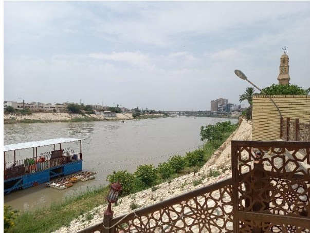
Cliché : Roussel Cyril, 2022

La montée de stress en 2018 dans tout l'Irak était liée au remplissage du barrage turc d'Ilisu, dernier ouvrage réalisé sur le Tigre par la Turquie (mise en eau du réservoir à partir du 1 er juin 2018). Mais il ne s'agit que de l'un des 22 barrages faisant partie du projet du sud-est de l'Anatolie, le fameux projet GAP. On comprend bien dans ces conditions le sentiment de vulnérabilité de l'Irak, dernier pays avant la mer, qui se perçoit comme pouvant être totalement asséché, car tributaire de ses voisins. À ce jour, il n'existe pas de traité international pour le bassin de l'Euphrate et du Tigre, ce qui expose l'Irak à des modifications unilatérales des débits d'eau par la Turquie et l'Iran.