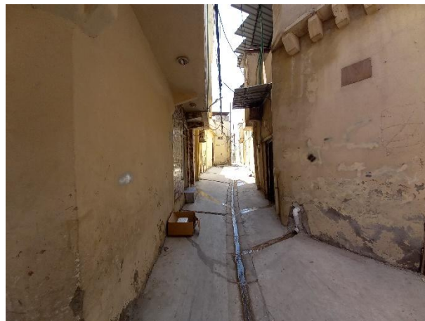
Cliché : Roussel Cyril, 2021