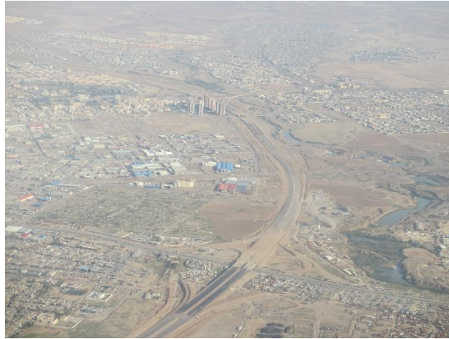
Cliché : Roussel Cyril, 2016