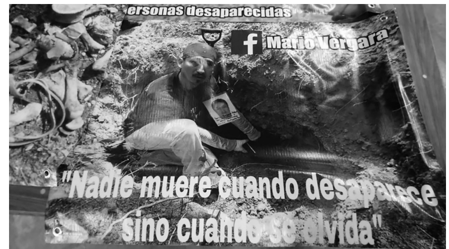
Imagen 10: “Nadie muere cuando desaparece sino cuando se olvida”.