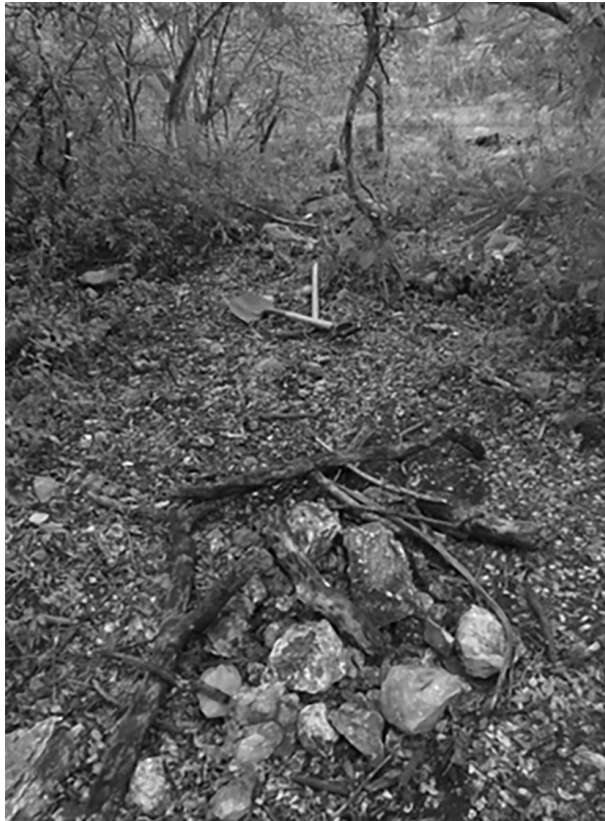
Imagen 9: Una “fosa clandestina” exhumada por Mario y ensamblada artesanalmente © S. Melenotte.

haber excavado su propio hoyo antes de ser asesinada y cubierta apenas con una delgada capa de tierra. Mientras habla, los ojos se le humedecen: en cada cuerpo que encuentra, vuelve a pensar en su hermano. Finalmente, coloca los huesos del pie dentro del calcetín, los reúne con esmero y los cubre nuevamente con tierra, entonando una oración improvisada, entre lamento y canto de sanación, que busca apaciguar a los muertos y restituirles una forma mínima de descanso.