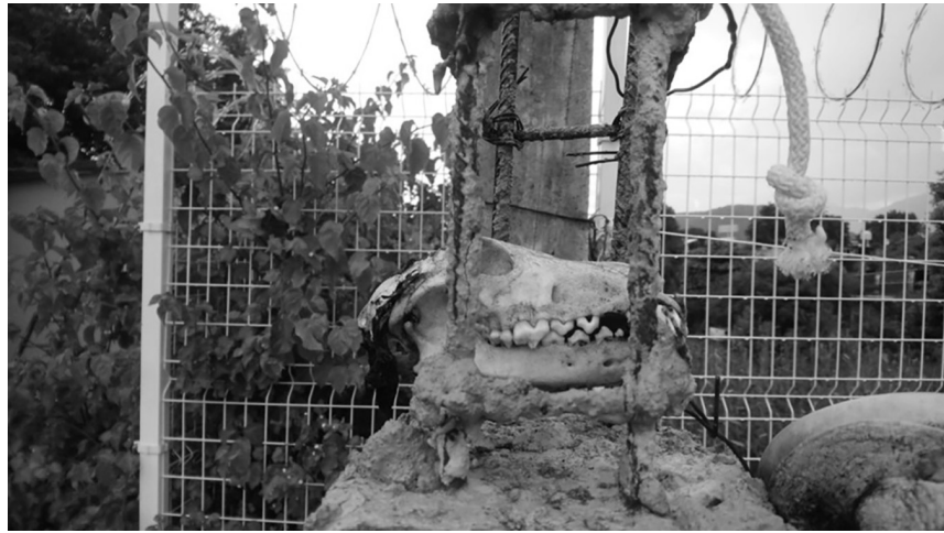
Imagen 5: Mario colgaba varios huesos en la reja de su casa © S. Melenotte.