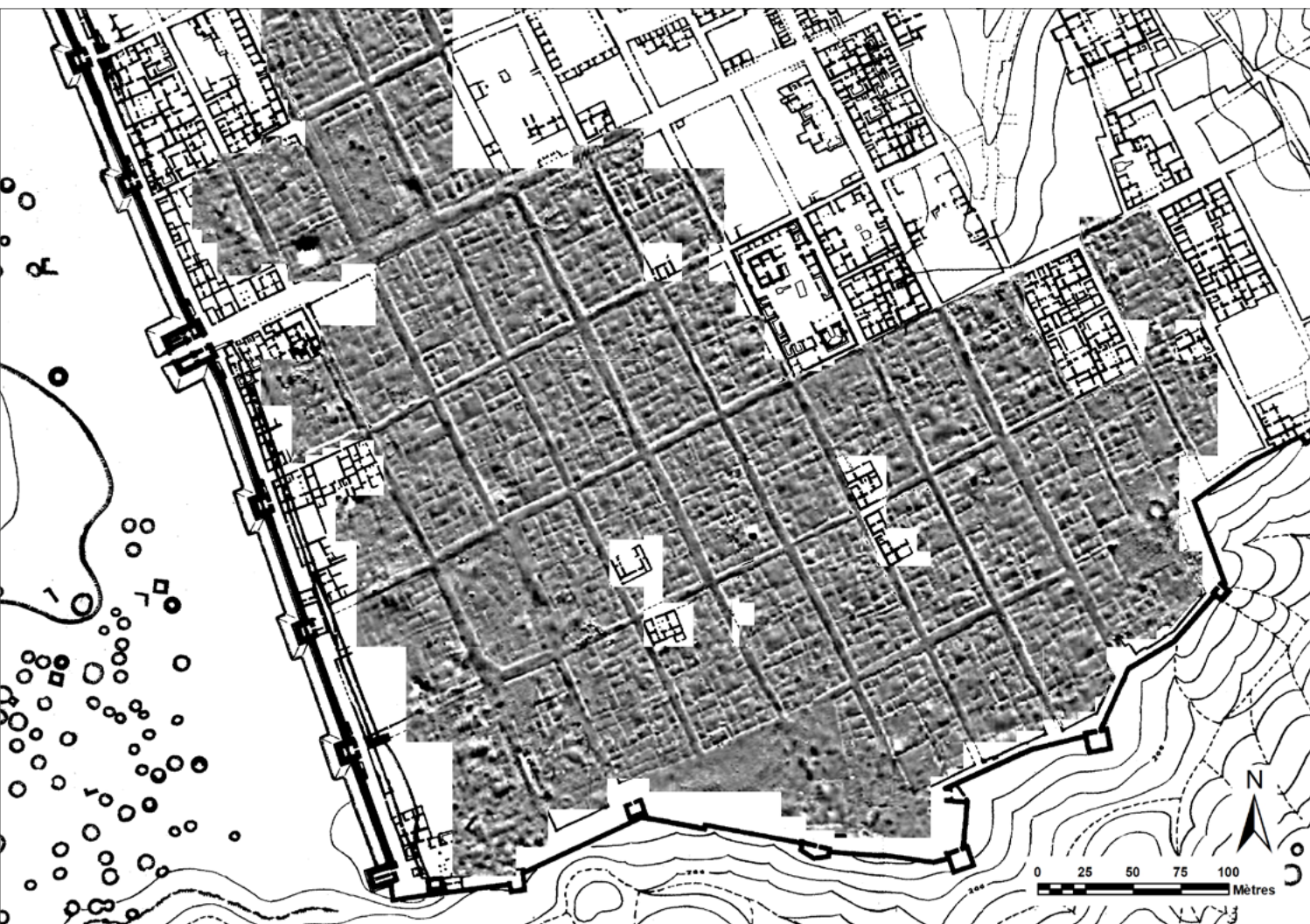
Prospection magnétique sur le site de Doura-Europos (Syrie) [prospection et restitution Ch. Benech].

Archéorient va alors commencer à se doter d'un parc de matériel plus conséquent afin de diversifier les approches géophysiques, mais aussi de développer un programme en Recherche et Développement (R&D) ambitieux et répondant aux besoins spécifiques de l'archéologie. L'impulsion lancée par l'Agence nationale de la Recherche (ANR) pour créer des laboratoires communs entre laboratoires publics et compagnies privées, connus sous le nom de «LabCom», est un dispositif qui répond exactement aux besoins du jeune pôle géophysique d'Archéorient. Un projet est soumis en 2015, en collaboration avec la société Éveha International, et retenu la même année par l'ANR. Le LabCom GEO-HERITAGE, codirigé par Christophe Benech (Archéorient) et Thomas Creissen (Éveha International) est né. Le programme géophysique du LabCom, qui débute en 2017, est construit sur deux axes : le premier sur l'adaptabilité et l'ergonomie des appareils géophysiques qui, dans la plupart des cas, ne sont pas conçus