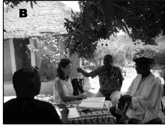
Figures 2 et 3 : Séances d'entretiens collectif à Cabrousse (A) et individuel à Diembéring (B)