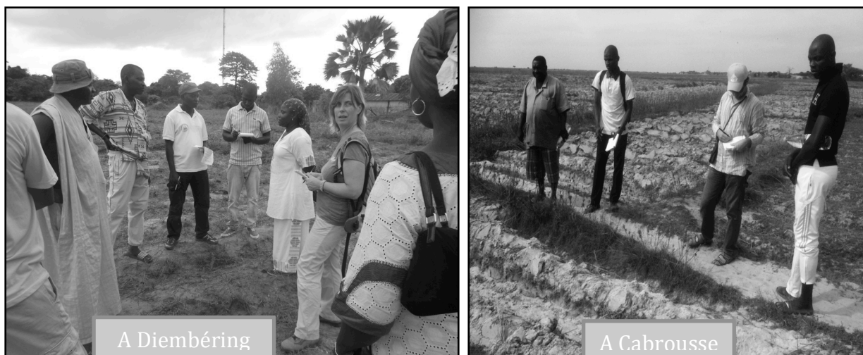
Figures 9 et 10: Entretiens sur des parcelles rizicoles à Cabrousse et à Diembéring