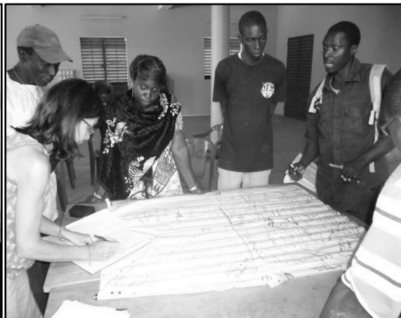
Figures 4 et 5 : Les habitants de Diembéring : échanges et construction des cartes de terroir

Les populations ont commencé par tracer la route principale entre Cap-Skiring et Diembéring et délimiter l'Océan Atlantique. Une fois la route tracée, le premier site d'habitation des villageois a été localisée. Ce site s'appelle Kikinou et d'après le vieux Joseph, ce site à plus de 200 ans. Ensuite, les villageois ont migré vers un second site appelé Sangawat qui abritait le