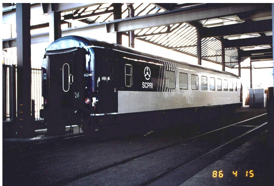
Figure 5 : La voiture rail en avril 1986.

L'équipage de la voiture est composé de 10 à 15 ingénieurs et techniciens suivant le type d'intervention. La voiture rail dispose en outre d'un groupe électrogène autonome pour assurer son alimentation électrique pendant 36 heures en cas de besoin 11 . Elle mesure 24,50 mètres de long pour 3 mètres de large et permet de transporter une charge utile de 18 tonnes. Ses bogies 12 et freins électromagnétiques permettent d'atteindre la vitesse de 200 km/h. Des essais de stabilité à cette vitesse sont réalisés en mars 1986. La voiture rail est stationnée dans un hangar du camp militaire de Satory dans les Yvelines et peut être déployée partout en France, avec le concours de la SNCF.