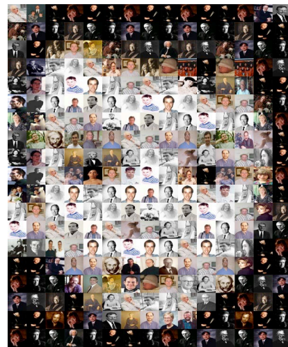
Frag2. Fragmentation importante et transparence

Les deux images mosaïques ci-dessus illustrent des variations possibles de ce processus - leur rendu témoignant d'un des nombreux paramétrages possible de l'application. Il s'agit ici