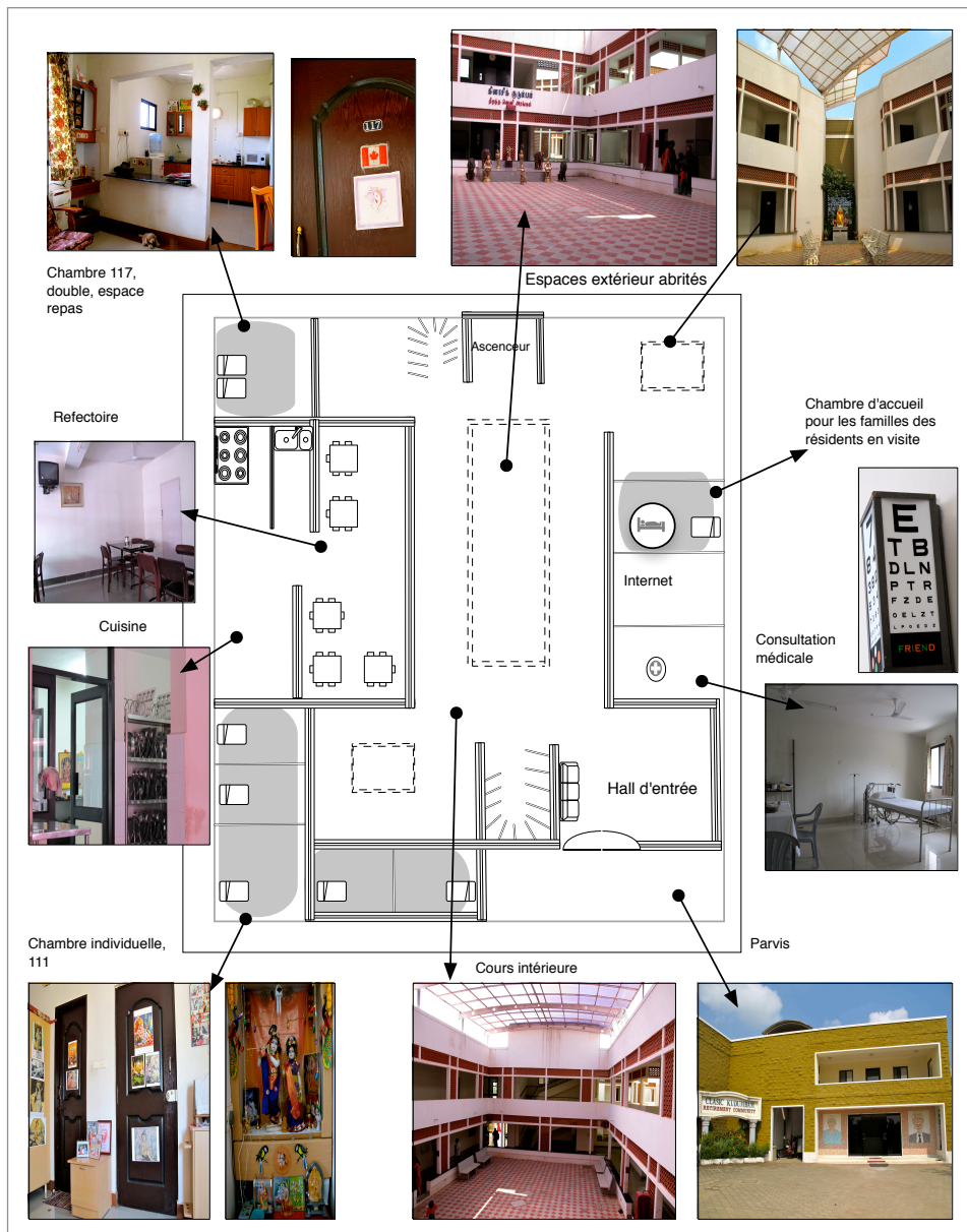
Figure 27 – Aménagement de Clasic Kudumbam, Chennai.

® Réalisation personnelle, crédits photos : M. Plard, Chennai, Tamil Nadu, 2011.