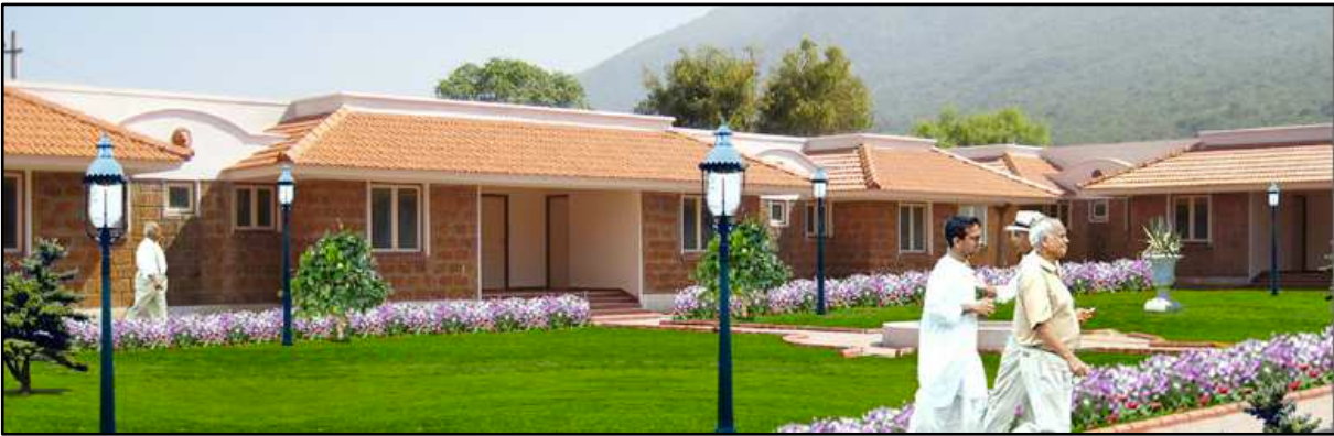
Figure 26 — Aarogya Kudumbam, Coimbatore.