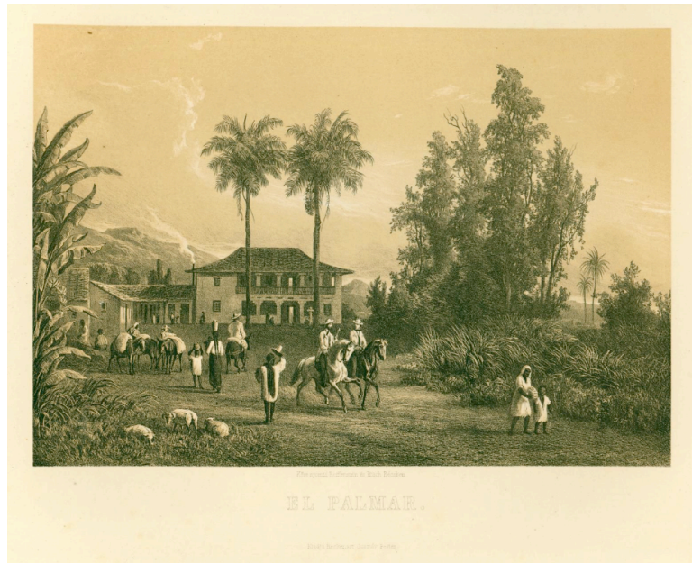
Hacienda El Palmar. Lithographie de Pal Rosti

En 1858, les hacendados de la région de la Sierra se plaignent des pertes de main d'œuvre occasionnées par la participation des peones dans les rangs des rebelles ; situation qui ne fait qu'aggraver le manque de main d'œuvre déjà signalé. D'autant qu'elle se double, et ce de plus en plus à mesure que la situation se dégrade, du recrutement de cette même main d'œuvre agricole « pour intégrer les milices et unités militaires spécialement destinées à combattre les rebelles » 226 , alors qu'en 1845 le gouvernement avait mis fin au service militaire, le limitant à un service minimum afin qu'ils puissent servir de force de remplacement uniquement en cas de troubles graves. Ce qui va prévaloir une grande partie des années 40 et s'accroître sous la présidence des Monagas.