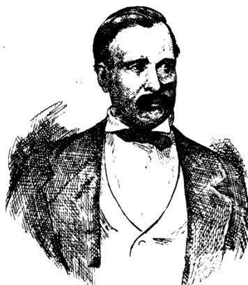
Comandante Zoilo Medrano

Un apprentissage du politique entre engagement et contrainte Venezuela, 1858-1859