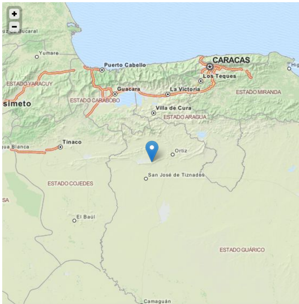
Vue générale de la zone où se situe le hato de Mapire (en bleu), au cœur de la zone d'action de la Faction.

supplémentaire, et non des moindres, du puzzle que constituent ces relations de parentèles existant autour de l'un des chefs de la Faction. Elles témoignent également de l'importance que représentent ces liens familiaux pour la longévité de la Faction et la capacité de ces groupes armés à résister aux forces gouvernementales, dès lors qu'ils ne relèvent pas (ou pas uniquement tout au moins) de la contrainte dont nous avons pu voir l'effectivité par ailleurs.