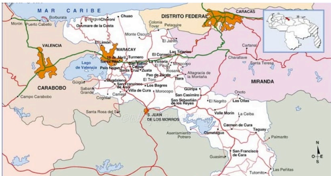
Cette contre-attaque est déclenchée à partir de Manuare, située au sud de Guigüe dans la province de Carabobo et se dirige vers l'est dans la province d'Aragua