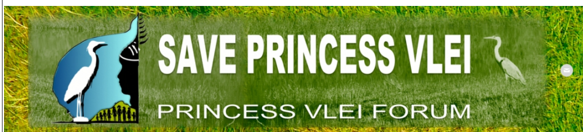
FIG. 9 : Bandeau de présentation du site du Princess Vlei Forum

On reconnaît sur le logo du Forum une aigrette symbolisant la zone humide, ainsi que le profil de la princesse et une ronde de résidents unis superposés sur la forme en goutte d'eau du vlei et le profil de la montagne de la Table. La légende de Princess Vlei dit qu'une princesse Khoisan, violée par les explorateurs portugais, aurait tant pleuré que ses larmes auraient formé le vlei .