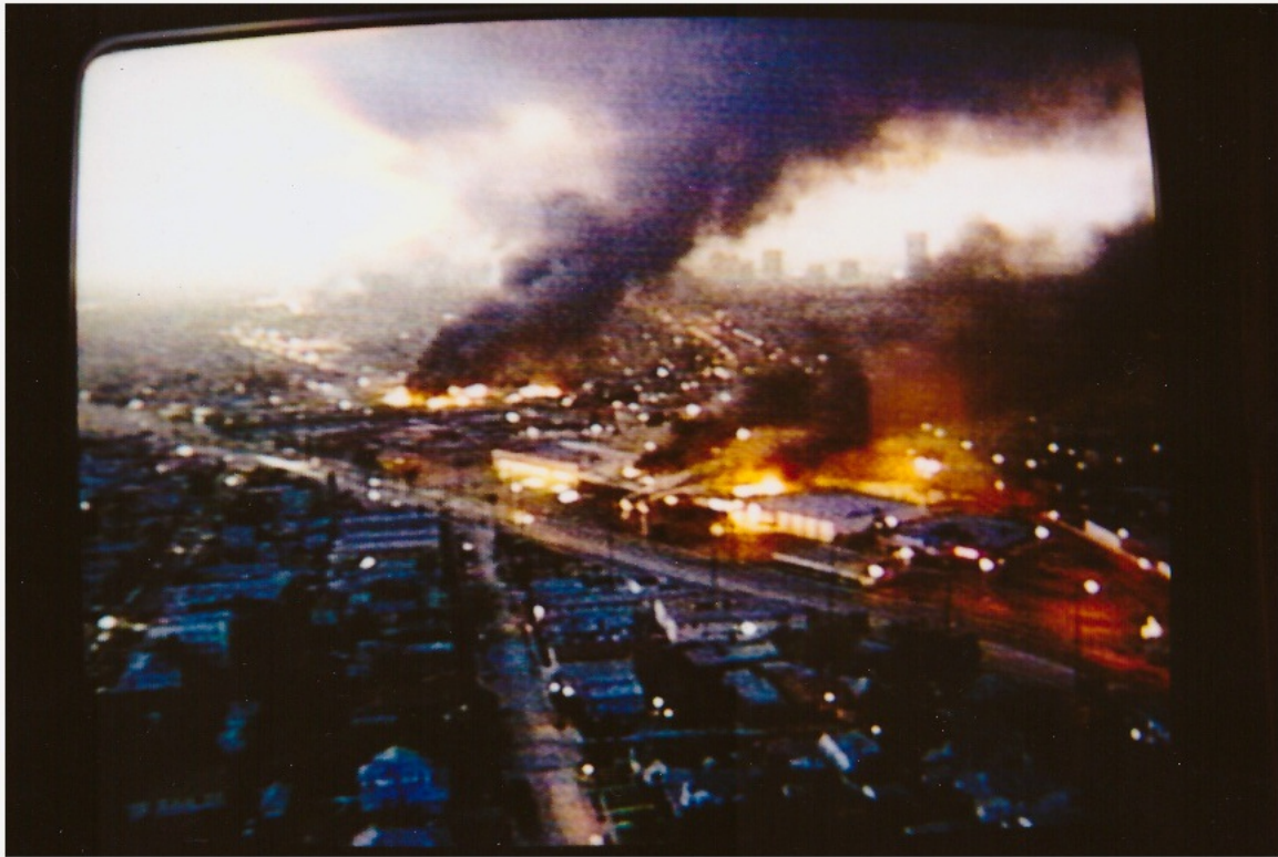
Photographie d'un écran de télévision prise à Davis, Californie du Nord.

Quelques jours avant le Premier Mai 1992, je suis dans le train qui m'emmène de la gare de Davis en Californie du Nord vers celle de Monterrey sur la Côte Centrale californienne. Alors que je suis basée à l'Université de Davis en Californie du Nord pour faire mon terrain de Maîtrise sur Sacramento, un ami angeleno m'a invitée à venir passer quelques jours dans la maison de vacances familiale de Carmel. Le parcours en train est bien plus pittoresque qu'en voiture, suivant vers l'Ouest les méandres du fleuve Sacramento jusqu'à son delta puis obliquant plein Sud à travers les séries de plaines côtières agricoles de la Californie Centrale. Il renvoie aussi à toutes les références historiques et littéraires attachées à l'espace rural californien, et j'attends avec impatience l'arrêt à Salinas, mon pèlerinage personnel sur les lieux de l'action d' À l'Est d'Eden de John Steinbeck. Mais à mi-chemin, alors que le train doit stopper en gare centrale de San Francisco, une annonce du contrôleur fait savoir aux passagers que le train ne franchira pas aujourd'hui le pont