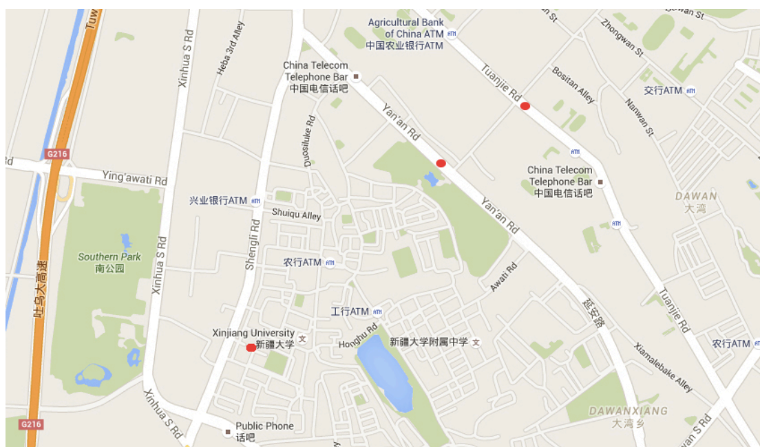
Figure 2- La circonscription de Tiānshān (2)