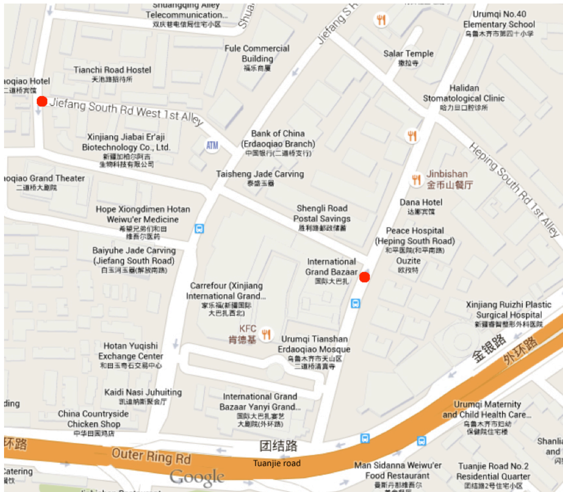
Figure 1- La circonscription de Tiānshān (1)