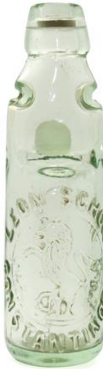
Figure 4a : Bouteille d'eau gazeuse « Leon Schor Constantinople »

À même le verre, la voici, la marque. Pour ne pas être un contenant standard, la bouteille est moulée de manière à symboliser la singularité de son contenu, comme c'est communément le cas jusqu'à nos jours. La présence de ce design devait aller tant de soi qu'à aucun moment il n'en est question dans la supplique (ou du moins dans son résumé par les autorités). Par chance néanmoins, les bouteilles d'eaux gazeuses ont leurs collectionneurs. Encore aujourd'hui, certaines de celles qui circulaient dans l'Istanbul de la fin du XIX e siècle s'échangent sur le marché des amateurs. Chacune mesure une vingtaine de centimètres de hauteur. Sur l'une d'elles nous voyons, moulé dans le verre, un cheval cabré, et l'appellation : « Léon Schor » (en alphabet latin ou arabe selon les cas). Une autre bouteille, sans moulage en relief celle-là, a conservé son fermetur ; la marque y figure, peinte sur la porcelaine, assortie d'une mention quasiment effacée.