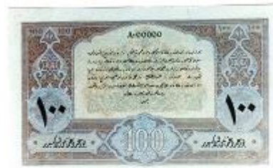
Figure 3b : Billet de 100 livres, spécimen, émission du 4 février 1332 (17 février 1917), verso et recto