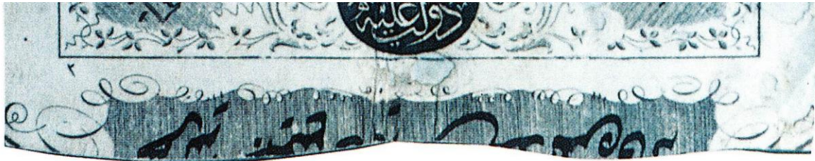
Figure 1b : Billet à ordre pré-imprimé diffusé au début des années 1840, recto (détail)

Chaque billet imprimé comportera également en appendice une languette de trois à quatre doigts [7,5 à 10 cm] à partir du côté inférieur au numéro du billet, qui servira à la reliure en volume, et où l'on portera aussi lors de l'émission, à la plume et à l'encre indélébile, la mention "Billet tenant lieu d'argent liquide émis par le Trésor des finances". Cet appendice sera sectionné comme le montre le spécimen présenté : les billets originaux émis seront détachés un par un en découpant au taille-plume de façon irrégulière, transversalement à la mention inscrite. Et les petites découpures reliées seront versées au Trésor des finances pour servir le cas échéant à d'éventuels recouplements 16 .