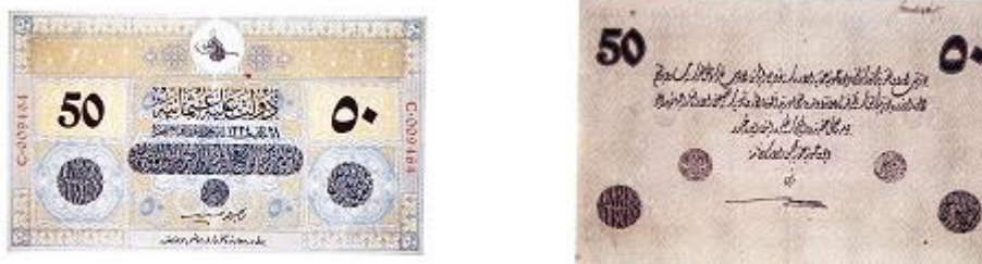
Figure 2 : Billet de 50 livres, série C, émission du 28 mars 1334 (28 mars 1918), recto et verso