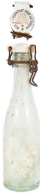
Figure 4b : Bouteille d'eau gazeuse avec fermoir « Leon [Schor] représentant pour la Turquie »