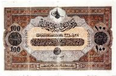
Figure 3a : Billet de 100 livres, série C, émission du 28 mars 1334 (28 mars 1918), recto et verso

Plusieurs fac-similés permettent de se forger une image plus précise de ce à quoi ressemblent les billets de 100 en question :