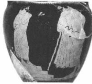
Fig. 27 An orator speaks from the podium. Attic neck amphora, ca. 480 B.C. Paris, Louvre. (P. Zanker 1995 : 47).

Vase avec représentation de la main à l'intérieur du manteau :