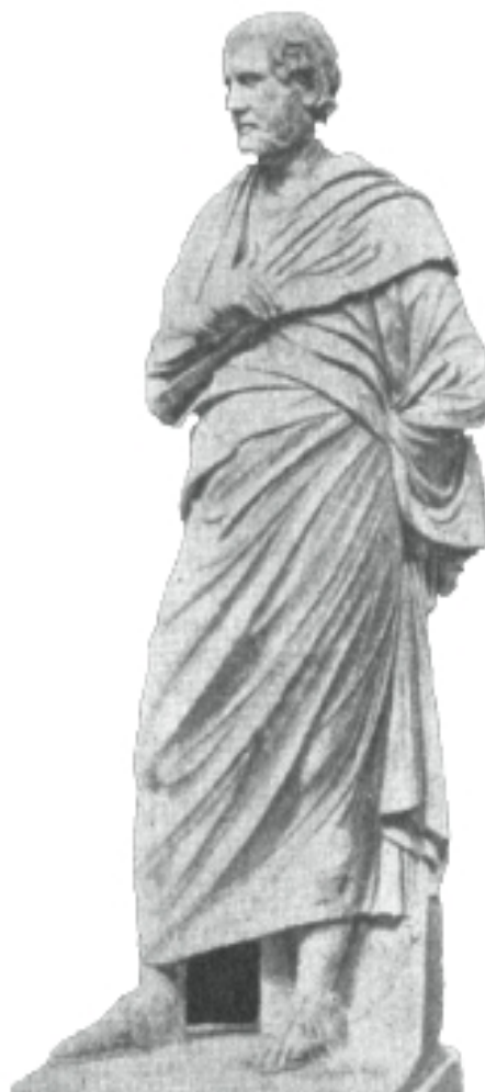
FIG. 5b. – Statue d'Eschine provenant d'Herculanum. Musée national de Naples.

« En bref, Théodore Reinach voit donc dans la statue dite de Sophocle du Latran une copie romaine en marbre, non pas de la statue en bronze de Sophocle érigée au théâtre d'Athènes, mais de la statue en bronze de Solon érigée sur la place de Salamine, œuvre qui daterait des années 390 av. J.-C. et serait sculptée par Képhisodote, le père de Praxitèle. » 11