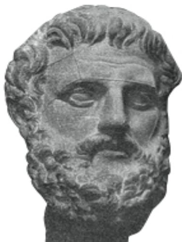
FIG. 6a. – Tête de la statue du Latran (cf. fig. 2).

Le savant Th. Reinach fonde son raisonnement sur la comparaison de la statue de Latran à un buste portant de Florence portant l'inscription « Solon législateur » :