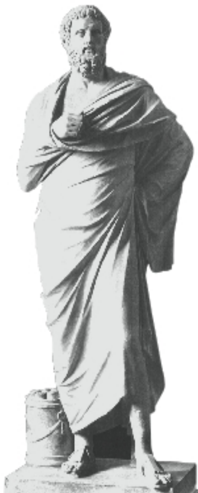
FIG. 5a. – Statue du Latran (maintenant au Vatican ; Museo gregoriano profano, inv. 9973) (= fig. 2).