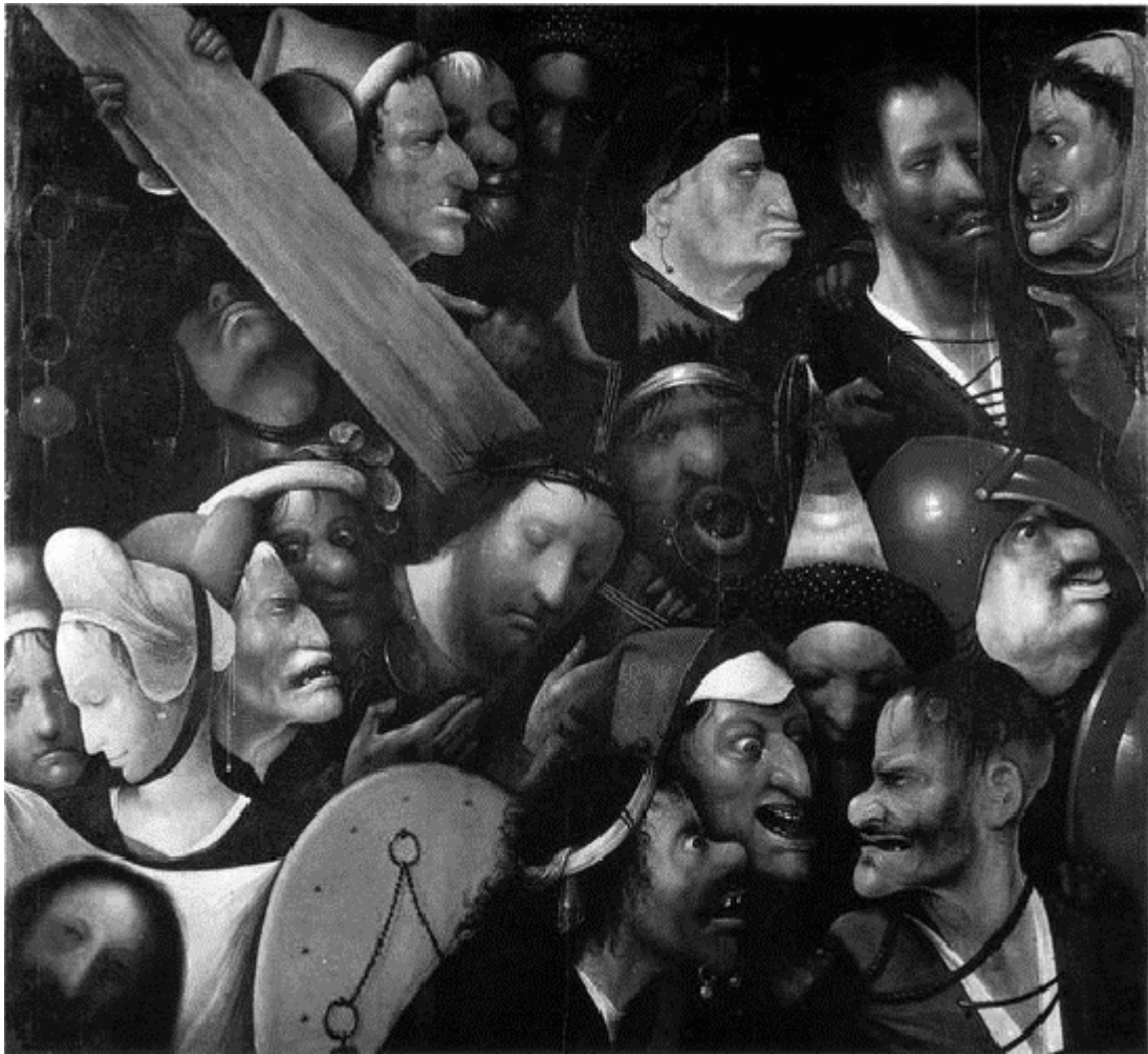
Jérôme BOSCH. Le portement de croix (entre 1510 et 1516). Musée des beaux-arts, Gand.