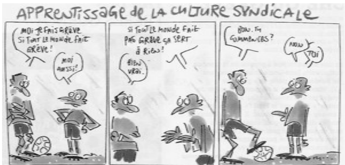
Lefred-Thouron, L'Equipe Magazine , n° 1370, 11 octobre 2008

Quand le syndicat des footballeurs professionnels menaçait de recourir à la grève pour protester contre un projet de réforme du conseil d'administration de la Ligue Professionnelle de Football (LFP)