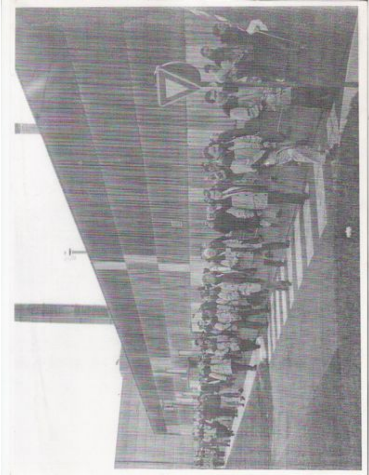
Défilé des grévistes de PSA dans l'usine d'Aulnay-sous-Bois, entouré d'agents de l'encadrement