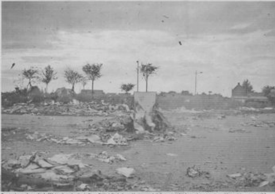
L'usine de Corbehem (Pas-de-Calais) a été fermée en 2011. Les salariés ont obtenu des indemnités pour les machines et les catalyseurs de V6C.

L a seule garde: «Dallez, les ouvriers implorent-elles devant l'usine de papier Stora Enso à Corbehem (Pas-de-Calais). Plus loin, les ouvriers bloquent le rond-point de l'accès au site. Francis Oti, Frédéric et les autres brûlent des rouleaux blancs géants. Ça sent le papier glacé cramoisi, des confettis de cendres s'échappent, ça chauffe. Francis ajoute du papier dans la fournaise. «On n'a rien prévu pour des jours comme ça, ça va être dur.» C'était pourtant parti pour être une belle histoire, un genre de Metalshop à France. Un centre de fibre les Petites Forêts qui réajusterait à environ 1000 tonnes. Après l'annonce de 400 suppressions de postes en 2011, l'association de salariés et une association de salariés, les Oubliés de papier solidaires, avaient réussi à convaincre Stora de vendre deux machines à un investisseur (à la famille Malherbe/Gauchon, Leroy-Martin). Gens Recovery, qui était prêt à reprendre les salariés sur le terrain. Et puis... Stora ne vend plus. La voix de Francis s'élève: «Mon grand-père est venu d'Italie pour travailler dans l'acier. Il nous a vus venir à l'af-