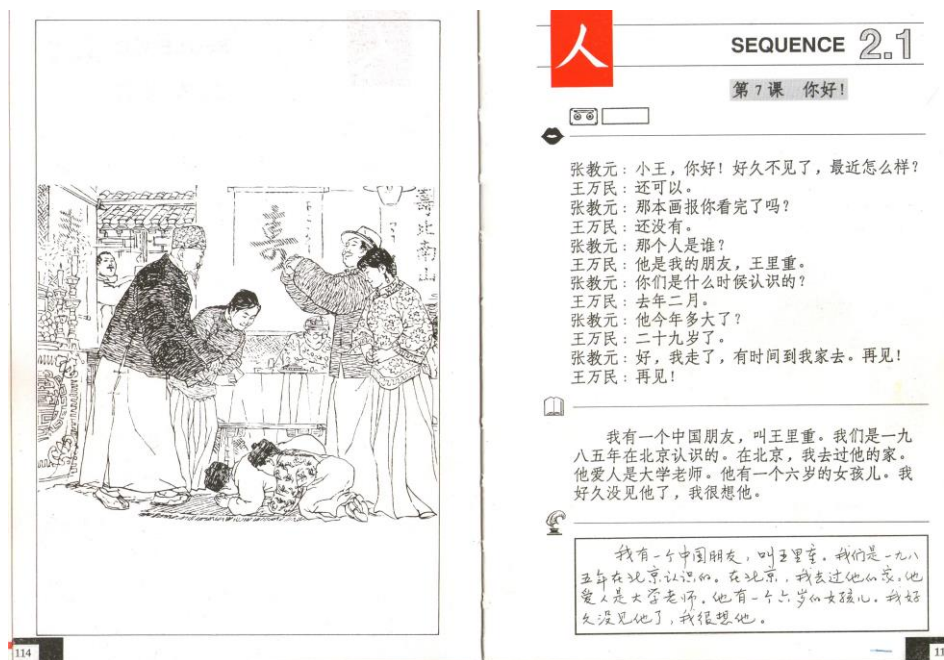
Illustration 6.1.2.3 : Méthode d'initiation à la langue et à l'écriture chinoises , 1989, pp. 114-115.

pas aux élèves de repérer des références partagées et d'identifier leur impact dans la société étudiée sur le plan de l'appartenance à une culture commune. Bien que cette unité présente l'histoire et l'économie de ces régions, les références historiques et socio-économiques communes ne sont, par contre, pas mises en situation. La proximité culturelle entre la France et la Chine, par exemple, les marques d'appartenance à un milieu socioprofessionnel, les références partagées par une même génération, sont presque invisibles. Les professions apparues dans les manuels sont, soit dans la plupart des cas non-identifiables, comme dans Initiation et Perfectionnement , soit dans le triangle enseignants, élèves et parents, comme ce que nous pouvons aussi voir dans Ni Shuo Ne ? . Bien que les interviews réalisés avec les natifs dans le DVD de l' Authentique montre une diversité des professions, cette diversité se trouve que dans la présentation identitaire et ne fournit pas de marques d'appartenance à un milieu socioprofessionnel. La capacité à relativiser les deux cultures ne peut pas s'instaurer avec une seule concentration sur les différences culturelles, tout en négligeant les points communs.