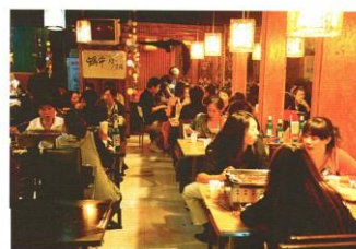
Illustration 6.1.4.1 : Ni Shuo Ne ? p. 90.

该你了 Jouez une scène dans un restaurant entre le serveur et les clients.