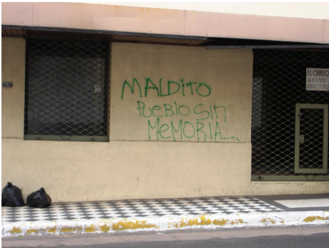
« Maudit peuple sans mémoire », Asunción calle Eligio Ayala avril 2006