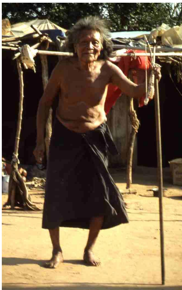
Vétéran maka de la guerre du Chaco.