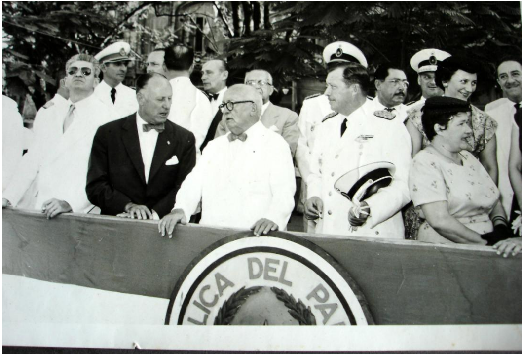
1 er mars 1955, inauguration du monument en hommage à « l'historien national » Juan O'Leary place de l'Indépendance, à la tribune officielle au centre O'Leary, à sa gauche le général Stroessner, à sa droite le représentant de la République argentine.