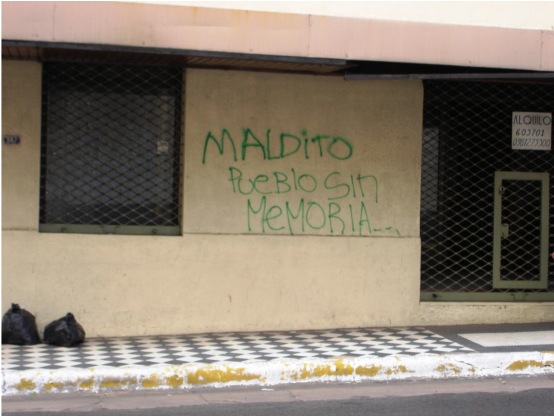
« Maudit peuple sans mémoire », Asunción calle Eligio Ayala avril 2006