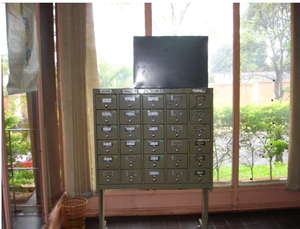
L'unique fichier thématique et auteur de la Bibliothèque nationale d'Asunción, avec celui du fonds E. Solano López. Seuls les tiroirs étiquetés sont utilisés. (Cliché L.C., 2006).

Variations sur le pays des femmes 1 est ainsi le produit d'une interrogation scientifique, d'un parcours intellectuel et d'une expérience individuelle. Je ne reviens pas sur la question scientifique initiale déjà abondamment exposée. Quant au parcours intellectuel on pourra observer que dans cet ouvrage convergent quasiment toutes les problématiques que j'ai suivies depuis une petite quinzaine d'années : la violence de guerre, la mobilisation, le genre, les identités sociales, l'histoire des représentations, la mémoire, l'écriture de l'histoire, le temps présent, le rapport à l'événement. Enfin l'expérience individuelle conjugue l'avant et l'instant de recherche. Il est peu probable que j'eusse été aussi sensible à l'écho de la guerre de la Triple Alliance si je n'avais pas séjourné durablement dans le Paraguay de Stroessner. De ce fait, lorsque j'atterrissais à Asunción en novembre 2000, quatorze ans après avoir quitté ce pays par la route via l'Argentine avec la conviction que je n'y reviendrais plus, je fus inondé par un flot de sensations qui ont certainement influées sur l'enquête. Néanmoins, la dynamique propre à la