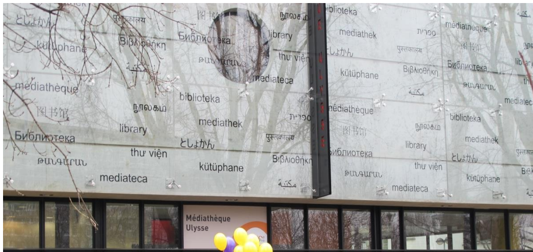
Bibliothèque Ulysse à Saint Denis. Cliché : janvier 2011

Le projet d'intégration sociale est également présent par la mise à disposition du public d'outils personnels orientés vers la réussite scolaire, la recherche de travail ou le développement personnel. Enfin, de plus en plus fréquente, la mise en réseau des équipements au sein d'un territoire est basée sur une hypothèse de « mobilité » du lecteur qui vise non seulement à désenclaver les quartiers mais aussi à les rendre attrayants pour les habitants d'autres zones de la ville, comme une façon d'attirer le centre vers la périphérie 348 .