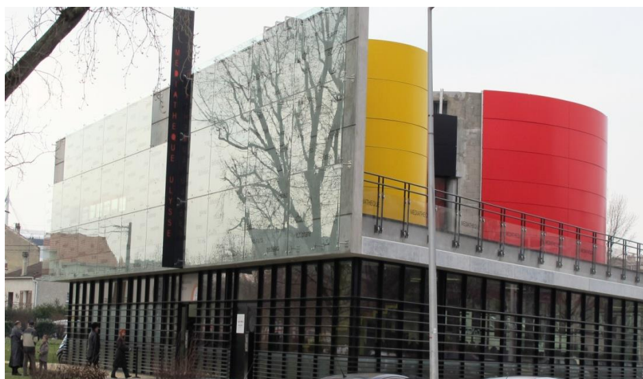
La bibliothèque Ulysse, le jour de son inauguration Le 29 janvier 2011

La présence de cette sculpture représentant à la fois le livre, la mémoire, la violence et les démolitions des habitations au milieu d'une cité HLM m'a donc surpris, et la première chose que j'ai observée en allant vers elle et en la regardant c'est la diversité de significations qui traversent ces espaces. À approcher la sculpture et à la regarder d'en bas, on peut apprécier la couverture du livre et sa fonction : la mémoire. Des habitations et du quartier réduit à un tas de décombres, rien ne reste. Si ce n'est la promesse d'une mémoire qui serait gravée dans les pages du livre. Ce livre existe. Nous apprendrons qu'une « brochure » a été imprimée par