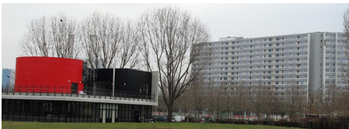
La médiathèque Ulysse en face des tours du quartier Franc Moisin, Saint-Denis. Cliché : janvier 2011

endroits et objets qui me paraissaient significatifs, comme je fais souvent. Sur la rue Danielle-Casanova (1909-1943, Résistante, morte en déportation, selon la plaque de rue), une cordonnerie et un petit supermarché avec l'inscription « Welcome to Supermarché de l'Est. Balkanique groceries » ; un coiffeur « spécialiste en coiffure mixte », avec beaucoup de photos ; un magasin « vente de produits exotiques et bazar » ; une immense affiche de propagande annonçant une « Nuit africaine » au Stade de France ; un restaurant kebab ; enfin, un panneau de signalisation indiquant le chemin pour le collège Federico García Lorca. Dans un espace d'affichage municipal, la mairie annonce « Bonne année Saint-Denis » sur fond rose, une jeune fille blonde couronnée jette le globe en l'air. Quelqu'un a écrit sur l'affiche : « Algérie en force ». Juste à côté, il y a deux autres affiches, bien plus petites. La première : « La rue râle. Appel de l'AG interprofessionnelle de Saint-Denis à la coordination des AGs interprofessionnelles. » Sur la seconde, le Nouveau Parti anticapitaliste annonce : « Tunisie. La révolution ce n'est qu'un début ». Je me demande comment je ferai pour intégrer ce magma d'informations. Je me dis aussi que les choses ne sont pas simples pour les militants politiques, ni pour les bibliothécaires, ni pour les habitants.