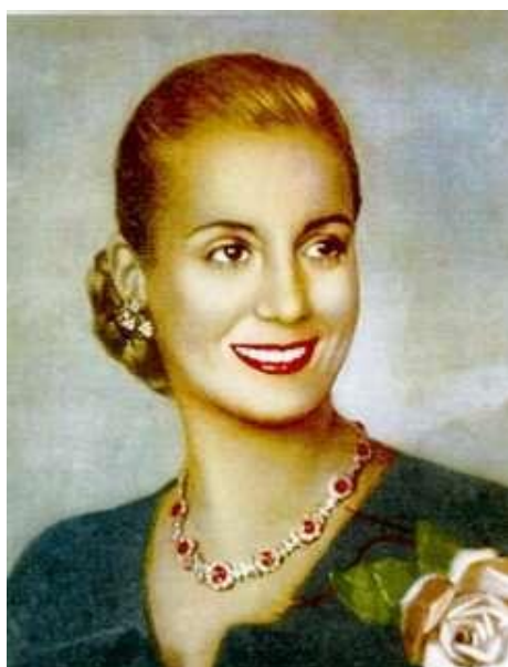
Eva Duarte de Perón, Evita , 1919-1952, représentée ici avec son célèbre chinon.

Nous orienterons à présent la réflexion sur trois dimensions de la conjoncture telle que nous l'avons perçue dans nos travaux. Cette conjoncture était évidemment celle de la question sociale, des évolutions du salariat et des politiques sociales. Mais c'était aussi une conjoncture politique et une conjoncture urbaine. Nous consacrerons les deux chapitres qui suivent à décrire ce double cadre, urbain et politique dans lequel j'ai commencé à forger mon regard sociologique et que je n'ai toujours pas abandonné.