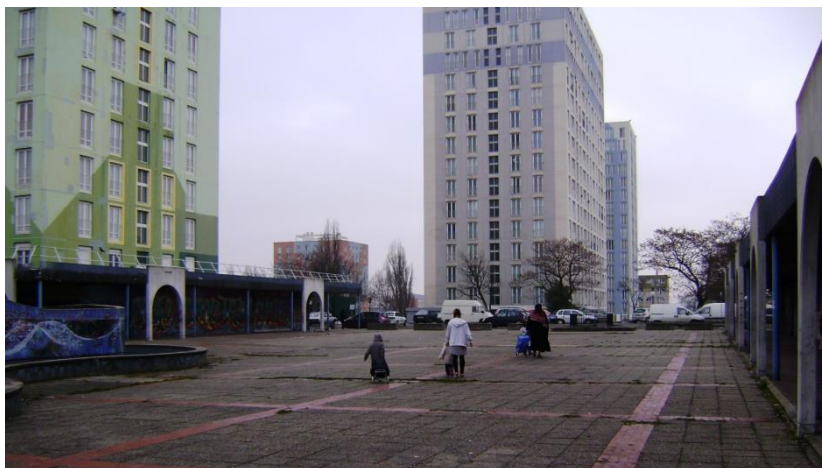
A côté de la Bibliothèque Jules Vallès.