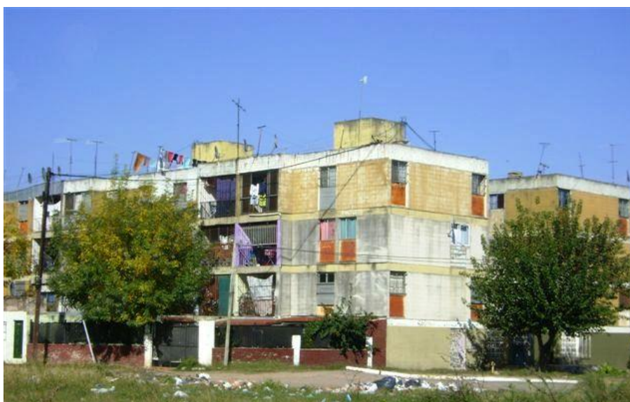
« Monoblocks » de Villegas.

et sur la ville est alors poussée à l'extrême avec un effet catastrophique : les habitants des bidonvilles ont vu leur sort fixée à jamais dans les núcleos , et les nouveaux habitants des monoblocks sont restés pour toujours des occupants illégaux. Aucun gouvernement n'est depuis intervenu pour trouver une solution. La ville de Buenos Aires, propriétaire des immeubles et des infrastructures se voit elle-même otage d'une situation créée il y a plus de trente ans par une dictature et aggravée ensuite par un mouvement politique qui prétendait contester cet ordre. Mais la capitale refuse de céder ces espaces immenses à La Matanza ou à la province de Buenos Aires. Ces deux dernières accusent la ville de Buenos Aires d'avoir résolu ses conflits sociaux en transférant les pauvres de l'autre côté de l'avenue General Paz, « périphérique » limite de la capitale. Quant aux habitants, ceux des chalets sentent leur territoire envahi de manière illégitime, ce à quoi ils attribuent l'origine de tous les maux. Ceux des núcleos se sentent à la fois abusés et trompés, par les autorités mais aussi par les habitants des autres quartiers qui leur ont volé leur droit. Ceux des monoblocks se sentent victimes de l'abandon des autorités et de la ségrégation des habitants des chalets. Tous ont des griefs envers l'autre, aucun ne dispose d'un moyen d'action les réunissant autour d'une « cause ». Fragmentée, Ciudad Evita est incapable d'une action commune.