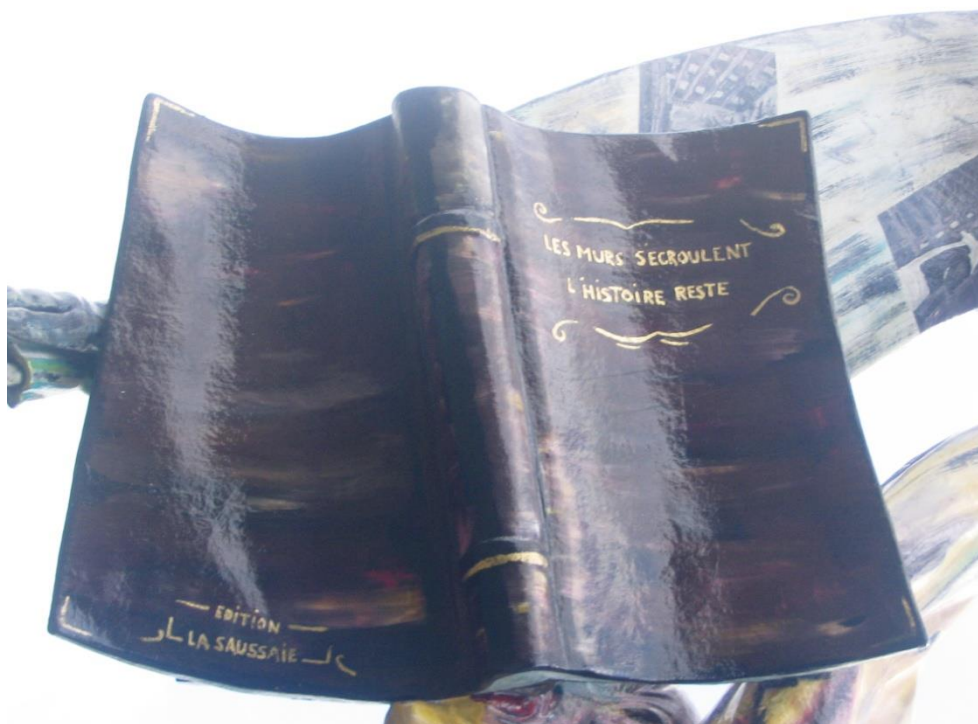
Les murs s'écroulent. L'histoire reste , Edition La Saussaie, 2000

la mairie avec la synthèse des travaux faits pour recueillir l'expression des sentiments face à la démolition. Cette mémoire n'est pas dans la bibliothèque du quartier, et nous ne l'avons jamais vue. Quelles sont les mémoires de la ville ? Quelles sont celles contenues dans la bibliothèque ?