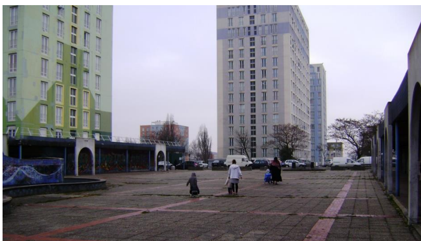
A côté de la Bibliothèque Jules Vallès.