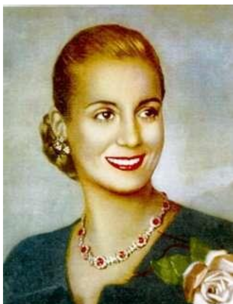
Eva Duarte de Perón, Evita , 1919-1952, représentée ici avec son célèbre chinon.

Nous orienterons à présent la réflexion sur trois dimensions de la conjoncture telle que nous l'avons perçue dans nos travaux. Cette conjoncture était évidemment celle de la question sociale, des évolutions du salariat et des politiques sociales. Mais c'était aussi une conjoncture politique et une conjoncture urbaine. Nous consacrerons les deux chapitres qui suivent à décrire ce double cadre, urbain et politique dans lequel j'ai commencé à forger mon regard sociologique et que je n'ai toujours pas abandonné.