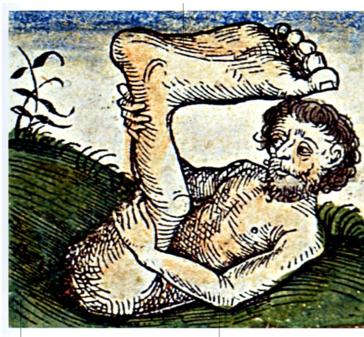
Sciapode, in Hartman Schedel, Liber chronicarum (Nuremberg, 1493)

Les voyageurs réussissent finalement à traverser le Sambatyon, et arrivent un jour à une steppe à végétation abondante. L'endroit ressemblait à une mer (agitée par une brise incessante) de fougères (vertes et jaunes) où même les chevaux ont du mal à avancer. Dans une clairière (qui ressemblait à une « île ») de cette mer bicolore, les aventuriers rencontrent le Sciapode Gavagai qui devient leur guide et leur fidèle ami jusqu'à sa mort (il s'est sacrifié afin que Baudolino et les autres puissent s'enfuir de la forteresse d'Aloadin). Celui-ci leur présente le pays, les habitants, les coutumes et les croyances religieuses. La mer ondoyante de fougères est une image symbolique, d'une part de cette contrée peuplée d'une multitude de races de monstres, et d'autre part de la structuration itérative du récit romanesque, qui présente d'ailleurs un vaste tableau d'un monde en mouvement.