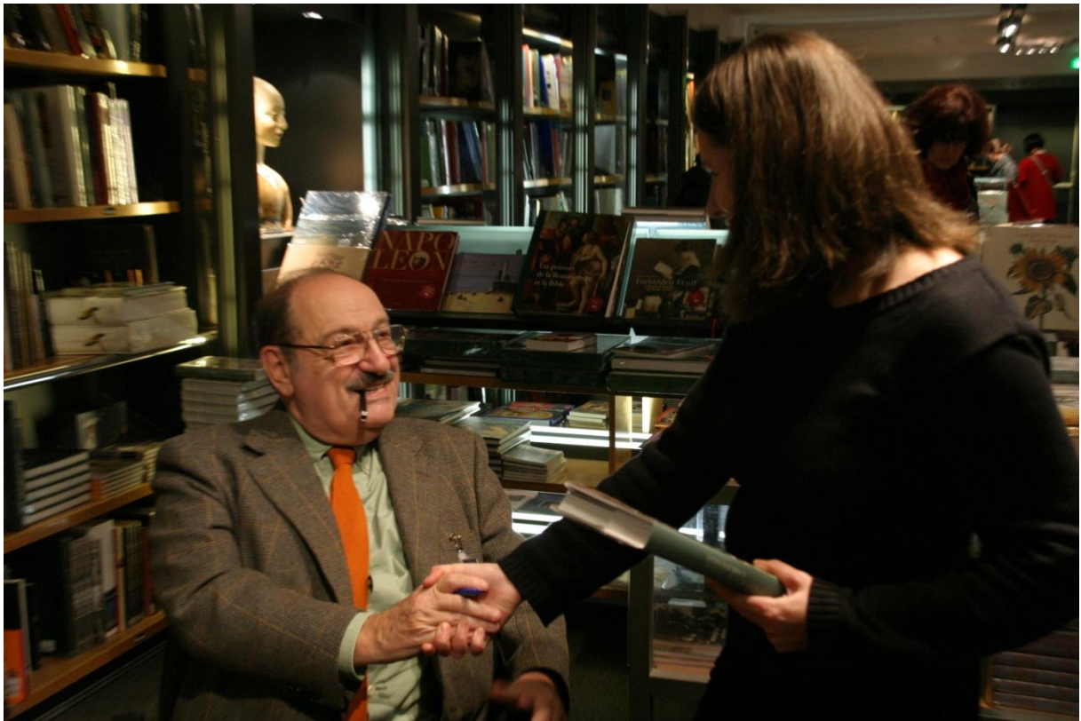
Umberto Eco, Musée du Louvre, 2009.