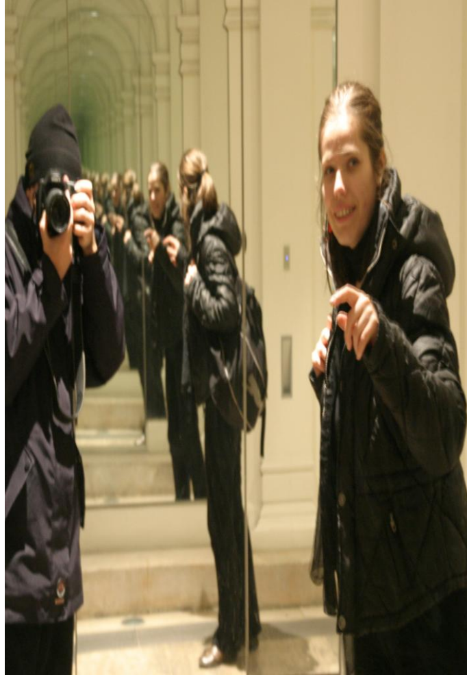
Mise en abyme imagée de type 2 : la réplication à l'infini

Pour réfléchir sur la mise en abyme énonciative, il nous faudrait commencer par la différenciation proposée par Émile Benveniste. En 1966, dans les Problèmes de linguistique générale (chapitre XIX), le linguiste français posait la distinction entre deux registres d'énonciation de l'histoire et du discours . Cette distinction entre ces deux niveaux (ou aspects) de l'analyse d'un récit occupera une place importante dans la narratologie fictionnelle. Si le premier terme sert à identifier les événements auxquels un texte se réfère, le second indique la manière dont ces événements sont présentés. Comme nous montrerons par la suite, la relation histoire / discours dans Il nome della rosa est étroitement liée à la mise en abyme de l'énonciation. Les événements exposés dans le texte sont présentés par le narrateur diégétique (intradiegétique) sous forme de travail en cours de développement. Le flash-back (analepse) et le saut en avant (prolepse) ne manquent pas, malgré le désir d'Adso de respecter l'ordre chronologique des faits.