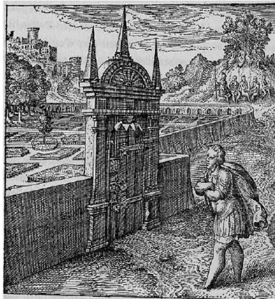
Michel Maier, Atalanta Fugiens (1618), L'Emblème XXVII

Le quatrième chapitre est précédé d'un extrait de l' Atalante fugitive de Michel Maier où l'on dit que celui qui tente d'entrer sans clé dans la « Roseraie des Philosophes » est comparé à un homme qui veut marcher sans pieds. Ce petit fragment de l'admirable « synthèse de l'art alchimique, poétique et musical 1 » qu'est l' Atalante , construit par analogie (avec la situation de notre personnage en quête du mot de passe) une mise en abyme très réussie. Casaubon passe une journée entière devant l'ordinateur, en jetant des coups d'œil tout autour pour chercher des indices. Devant la table de l'ordinateur une reproduction d'une estampe du dix-septième siècle représente allégoriquement la « Fama Fraternitatis ». Ses yeux se posent sur cette gravure où il essaye de « voir » un message codifié, une clé qui pourrait l'aider à trouver le mot de passe. Il décrit minutieusement cette image, en trouvant des rapports avec certains aspects de l'histoire que lui et ses deux amis ont imaginée et vécue. Il y cherche aussi la présence des nombres qui les obsèdent (36 et 120). Mais, ni ces nombres, ni les noms des dix sefirots, ni « Iahveh », le nom de Dieu, ne font s'ouvrir la « porte » d'entrée au monde virtuel d'Aboulafia.