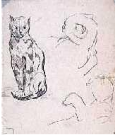
Delacroix, « Étude de chat assis et deux croquis sommaires de tête de chat », 1831

Mais, il n'écrira pas l' Œdipe des chats - nous dit le narrateur. Tout d'abord par ce qu'il appartient à un univers parallèle, celui des animaux où cette histoire n'existe pas. Ensuite, c'est parce que lui-même n'est jamais resté blotti au coin de la pièce (allusion à son statut de personnage de fiction), dans cette pièce où il y a maintenant un autre chat. En frôlant l'abyme de façon manifeste le pasticheur assure ici la cyclicité de son texte : le début et la fin du pastiche parlent d'un chat pelotonné au coin d'une pièce. L'univers de l' Esquisse se renferme ainsi sur lui-même. Cependant, grâce aux multiples jeux de réflexions générant des niveaux de représentations emboîtés à l'infini les uns dans les autres, le texte s'ouvre vers sa dimension intérieure. L' Esquisse suit de près le modèle de La Modification qui est un roman cyclique, d'une part parce qu'il se referme sur son propre début, c'est-à-dire que la réflexion de son personnage principal, Léon Delmont, aboutit à un statu quo, d'autre part parce que ce roman n'est que le récit de sa genèse.