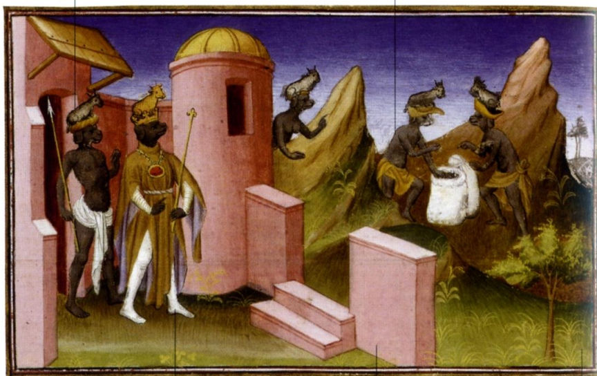
Hommes à tête de chien, in Odoric de Pordenone, Itinerarium (Le Livre des Merveilles) Enluminure sur parchemin, Paris, Bibliothèque nationale de France.

Ils sont amenés devant le vieux Aloadin, qui décide qu'ils sont trop vieux et décrépits pour être envoyés dans ses missions meurtrières, et que le mieux est de les garder captifs et de leur faire faire du travail domestique. Enchaînés, les prisonniers se racontent continuellement les événements passés : Paris, Alexandrie, le marché de Gallipoli, le séjour chez les gymnosophistes et à Pndapetzim. Ils discutent à propos de la lettre du Prêtre et de la mort de Frédéric. Baudolino, qui vivait replié sur lui-même et pensait beaucoup à Hypatie, ne réussissait pas à se rappeler le visage de sa fabuleuse bien-aimée, mais il se rappelait seulement la joie qu'elle lui avait donnée. Un jour, le fidèle Gavagai subtilise du miel vert aux eunuques et l'offre à son ami :