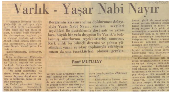
Figure 3 : article d'un journal sur la revue Varlık

Parmi les autres initiatives de la période, on doit mentionner les éditions Varlık , fondées en 1946 par Yaşar Nabi Nayır (traducteur, poète, écrivain) et la revue portant le même nom qui prennent toutes deux une place considérable dans la vie culturelle turque.