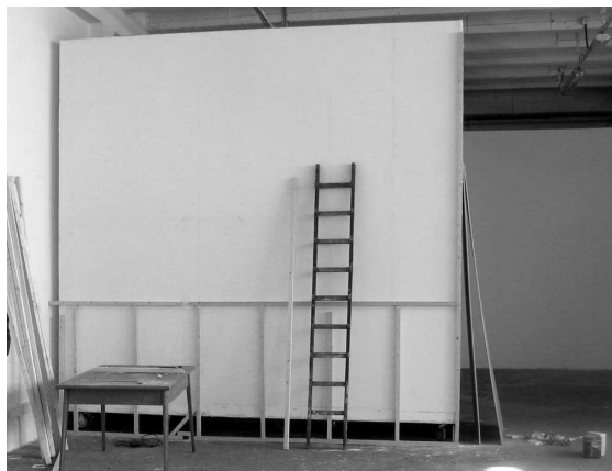
Figure 2 : Echafaudage et matériel pour préparer la fabrication de l'œuvre directement sur la cimaise. Photographie prise le mardi 26 février 2008, trois jours avant le vernissage.