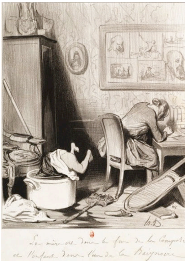
Honoré Daumier, planche n°7 de la série Les Bas-Bleus . Le Charivari , 26 février 1844

L'argument de l'indépendance économique envisagée pour ces femmes ainsi que la concurrence d'une nouvelle population sur le marché fragile de la production littéraire, en somme les enjeux économiques de cette pratique, sont également fréquemment avancés comme problématiques. Nous avons aperçu l'existence de ce questionnement dans la fiction, lorsque M me de Jarente est accusée de faire fuir les écrivains de son salon, effrayés qu'ils seraient d'une concurrence jugée comme déloyale. De même, dans un extrait des Bas-bleus d'Albert Cim, œuvre satirique parue plus tardivement (1891), alors que deux journalistes devisent du prix de la ligne dans la presse depuis qu'on y emploie des rédactrices, on peut lire que « l'avalissement des prix résult[e]nt de l'envahissement de la littérature par les femmes 578 ». Nous pouvons relever dans cette interrogation sur l'enjeu économique de la présence des femmes dans le champ littéraire le croisement de deux problématiques contemporaines : la grande production de livres des années 1830 et