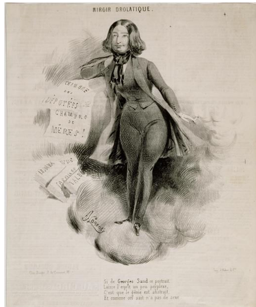
Alcide Joseph Lorentz, Miroir drôlatique , lithographie au crayon, 1840

La trajectoire de George Sand nous permet également d'interroger comment la transgression de l'acte d'écriture publique en presse s'ajoute à celle de la production littéraire que l'on refuse aux femmes. La célèbre caricature de George Sand, habillée en homme, embrumant par un nuage de volutes de cigarette de multiples feuilles, qu'on imagine de journaux, montre combien l'écriture des femmes dans les journaux est représentée comme une entorse aux règles de conduite imposées aux femmes 485 .