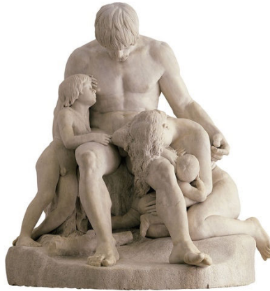
Caïn et sa race maudits de Dieu , Antoine Étex, 1832-1839, Musée des beaux-arts de Lyon.