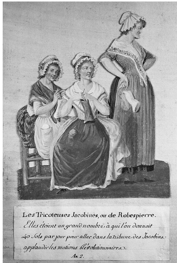
Les Tricoteuses jacobines. Gouache de Jean-Baptiste Lesueur. 1793, Musée Carnavalet.

« bas-bleu », traitement cynique reçu par toutes celles qui sortent de la sphère domestique et privée à laquelle on les destine, ou qui rendent publique cette sphère du privé (le tricot, activité domestique, ne devrait pas être montré ni sortir du foyer).