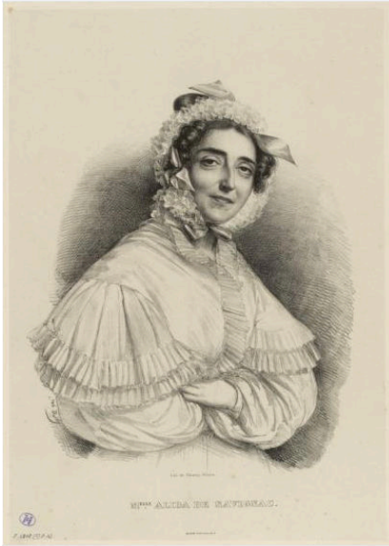
Alida de Savignac, dessin de Jules Boilly, in Biographies de femmes auteurs contemporaines de Montferrand.