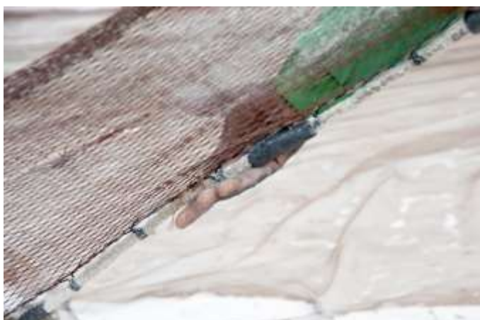
Planche 25 Plage de M'Bao (2014), geste de saisie dans le pliage du filet