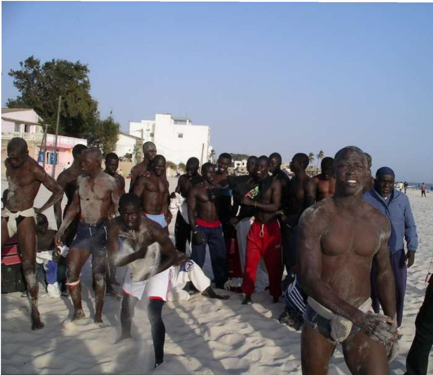
M'BAO (2011), « l'écurie de lutte M'Bao Lébougui »