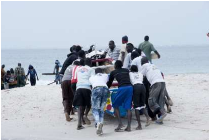
Planche 20 M'Bao (2014), mise à l'eau d'un bateau de pêche.

L'activité de pêche nous fournit des éléments pour une meilleure connaissance des techniques du corps dans l'espace social. L'approche anthropologique visuelle nous permet d'établir des formes d'usage du corps. L'observation, appuyée sur la technique photographique, est une occasion pour joindre un certain nombre de matériaux à l'analyse de la compréhension des «pratiques corporelles ». Ces expériences quotidiennes récurrentes qui rythment l'espace et le temps participent à forger l'imaginaire du corps. Dans notre espace lébou, le corps est mobilisé comme ressource. La pêche est, dans notre espace, une activité couramment collective. Elle est un lieu de transmission de savoir-faire. Cette sensibilisation est à la fois formelle et informelle. Elle se matérialise à travers l'expérience. L'activité de pêche est un lieu de partage, un lieu de vie. Ainsi la transmission s'inscrit dans la réalité d'un certain nombre de tâches, d'un certain nombre de postures et de formes d'utilisation du corps.