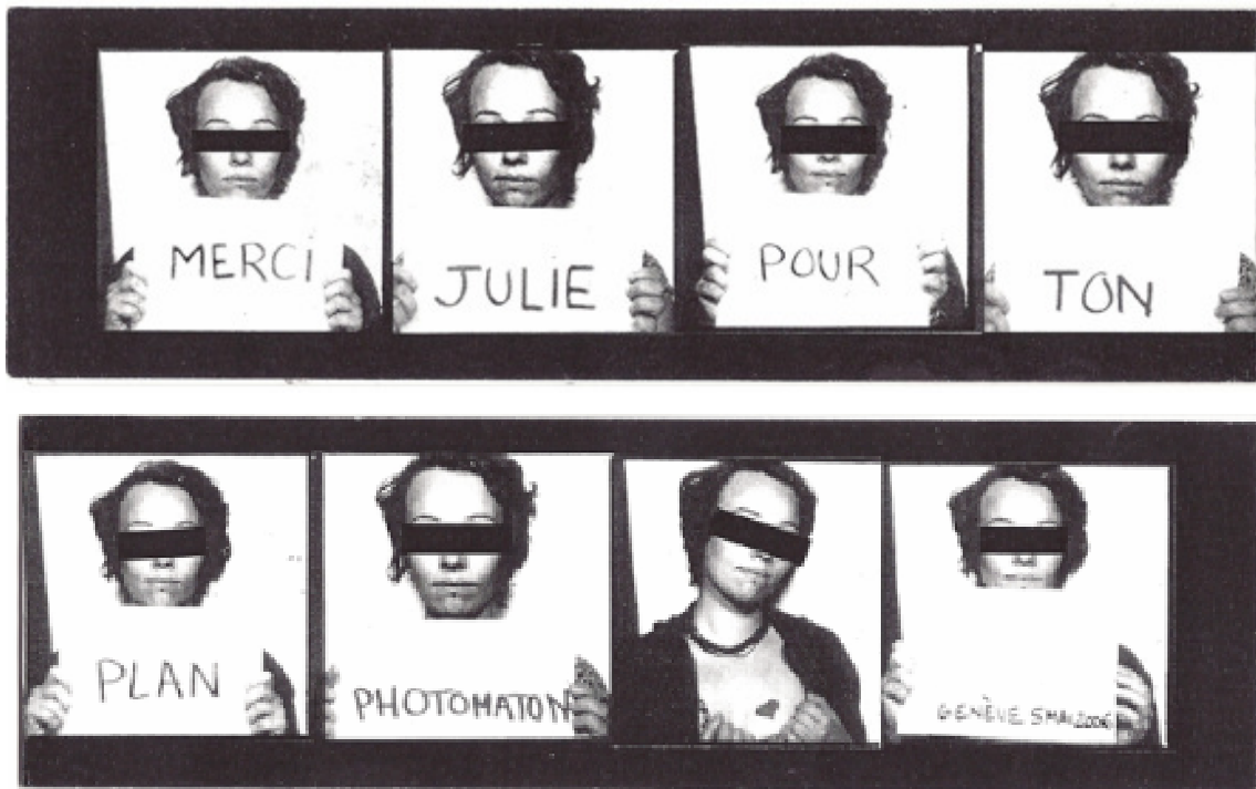
Fig. 25 : Photomaton

Le photomaton est compris comme l'interface entre elle et son amie défunte car elles avaient eu une histoire ensemble autour de ce photomaton et ce dernier lui permet alors de redistribuer aux autres le produit d'une relation avec la défunte. Elle reprendra alors certaines poses, notamment en forme de cœur, pour symboliser son attachement.