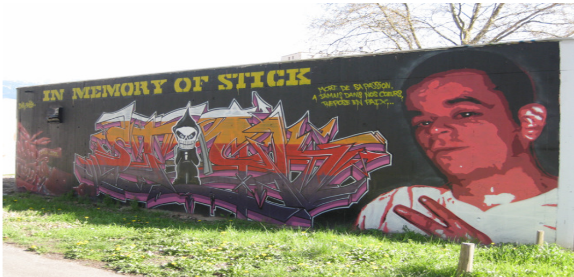
Fig. 25 : In Memory of Stick

Le premier a été effectué après 2004, le jeune avait 19 ans. Le second graf, pour un jeune décédé en 2008 à l'âge de 24 ans, a été produit à Grenoble sur un axe cycliste très fréquenté pour aller sur le site universitaire :