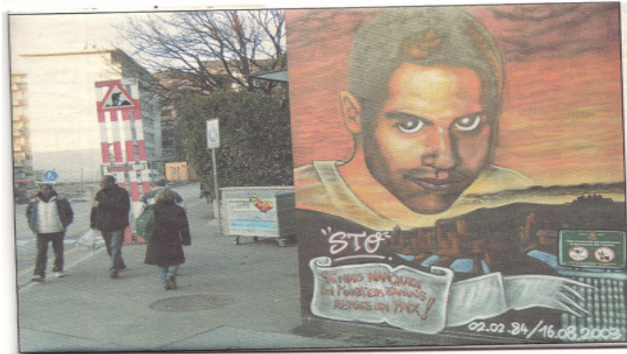
Fig. 24 : Graff (Tiré d'un article du journal Le Courrier (Genève), le 17 Décembre 2005, p10)

Le premier a été effectué après 2004, le jeune avait 19 ans. Le second graf, pour un jeune décédé en 2008 à l'âge de 24 ans, a été produit à Grenoble sur un axe cycliste très fréquenté pour aller sur le site universitaire :