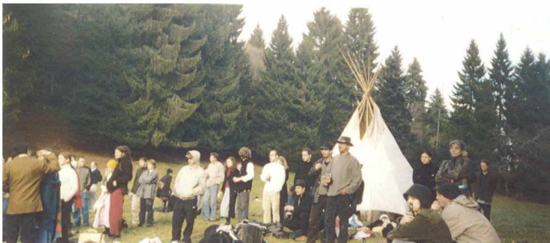
Fig. 19 : Amis et Tipi (1) 385

La montagne est liée au tipi comme la Nature à une maison universelle dans laquelle les personnes reconnues comme proches, ici les amis avec quelques parents, vont partager boissons et nourritures. Ce sont des instants hyper 384 beau(x) comme pour marquer la différence d'avec un quotidien caractérisé par son inverse, l'hypo, associé ici au manque de la personne défunte. L'image d'une journée super belle répond par contraste à des autres journées plutôt laides. L'espace extérieur paraît être une dimension importante, comme pour faire éclater les cadres funéraires traditionnels dont il faut s'émanciper, mais aussi pour être proche d'une réalité plus spirituelle à leurs yeux avec l'association à la « Nature ».