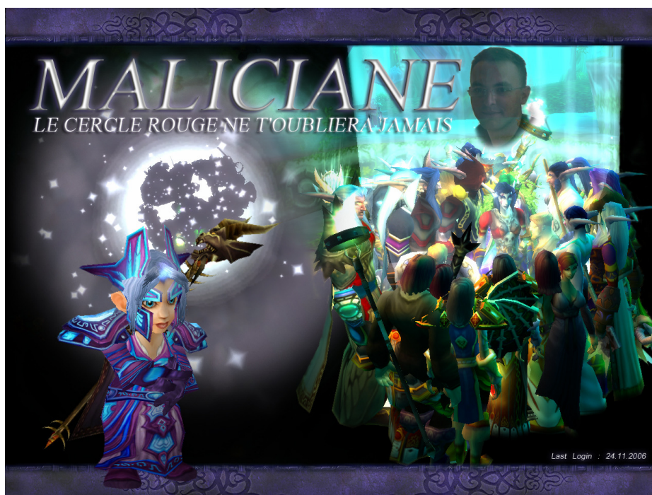
Fig. 26 : Maliciane I 405

Ayant appris le décès d'un des joueurs, les membres de la gilde ont décidé de se recueillir dans le jeu avec leur personnage respectif. Tous se sont réunis auprès d'un lac, le personnage du défunt aux bords de l'eau et tous les autres compagnons l'entourant dans un moment de recueillement. La plateforme du jeu en réseau a permis d'une certaine manière à tous ces joueurs de signifier l'absence à l'intérieur du jeu et de ritualiser l'adieu dans ce cercle d'appartenance particulier :