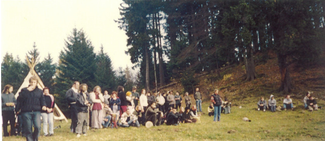
Fig. 20 : Amis regardant la déambulation (2)

La meilleure amie de Karine donne d'autres précisions sur ces instants où la déambulation en costumes prend sens :