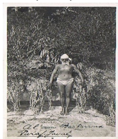
Paraf-Javal (Georges Mathias)