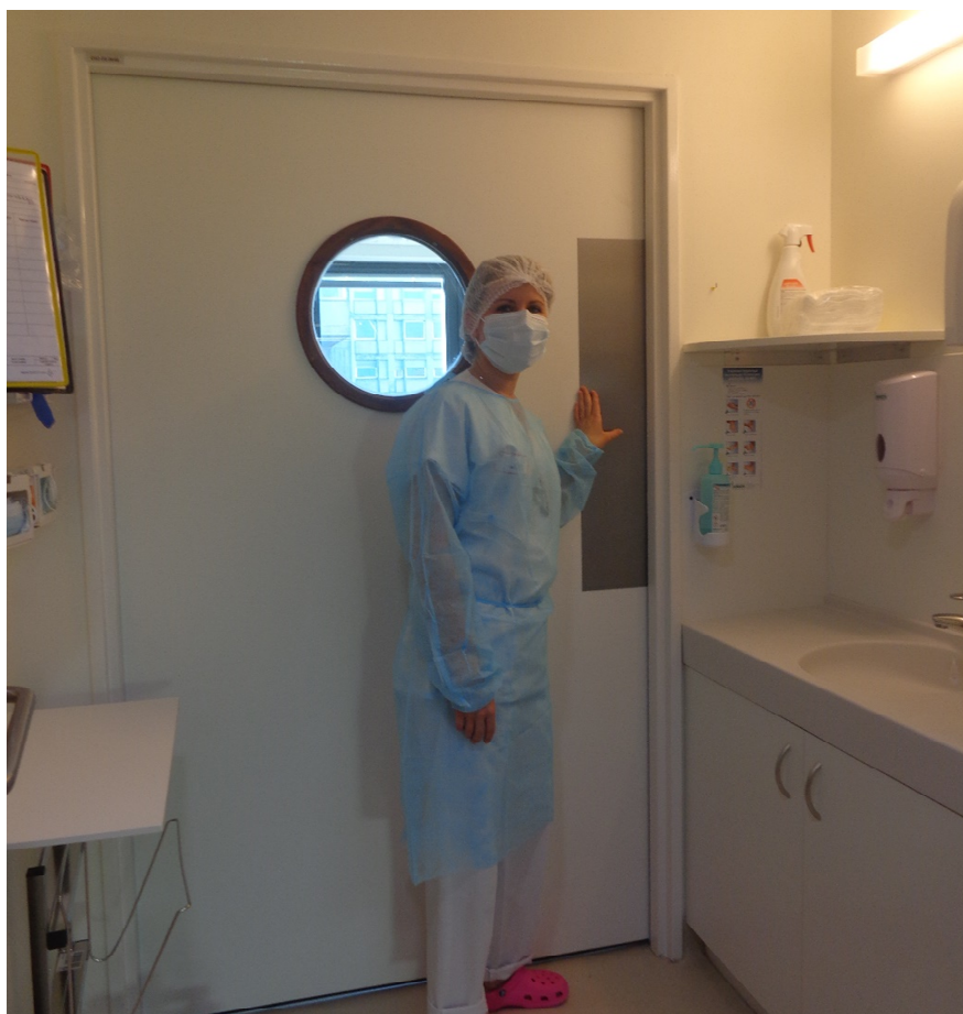
INFIRMIERE DU SEVICE DANS LE SAS D'UNE CHAMBRE

Le service est communément appelé : unité stérile, secteur protégé ou unité de soins intensifs en hématologie (U.S.I.H). Cette unité comprend des chambres à sas, que l'on appelle « chambres stériles ». De nombreuses mesures sont mises en place concernant l'hygiène, les objets personnels autorisés ou non, ou encore le linge et le nombre de visites de l'entourage qui est limité à deux personnes par jour. Toute personne entrant dans la chambre doit se vêtir d'une tenue stérile : masque, surblouse, charlotte et gants, surchaussures. La nourriture est dite « décontaminée », des mesures d'hygiène spécifiques sont mises en place et certains aliments sont proscrits.