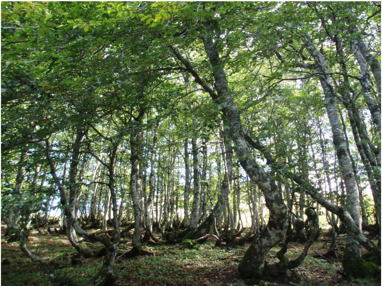
Hêtraie (Occabé, Iraty)