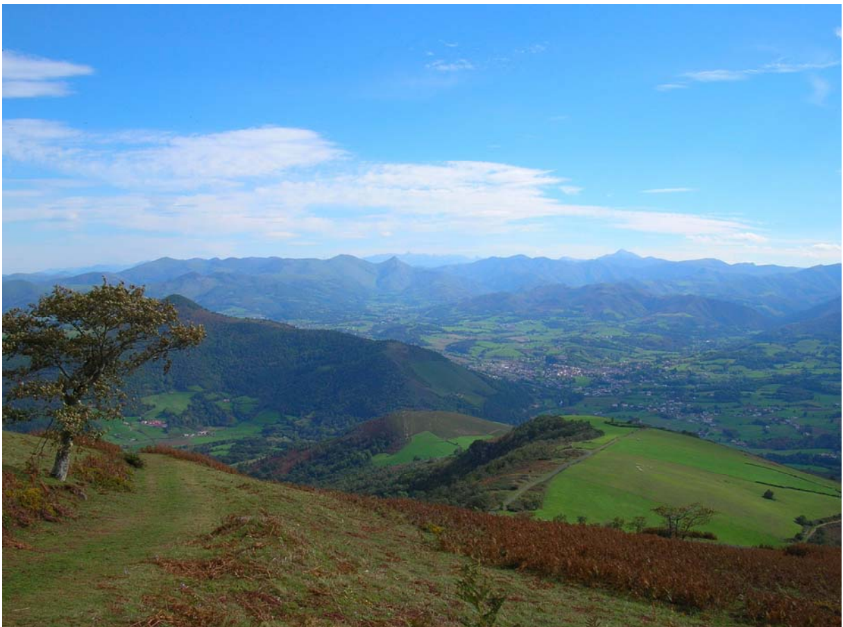
Le pays de Cize, depuis le Jara (G. Tessariol, 2005)