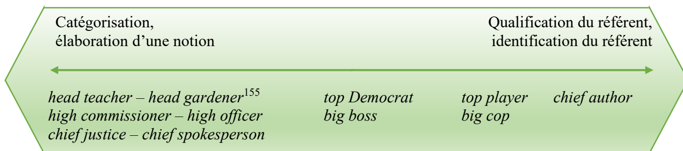
Figure 1. Continuum du rôle de catégorisation des dépendances

On pourrait représenter ainsi ce continuum :