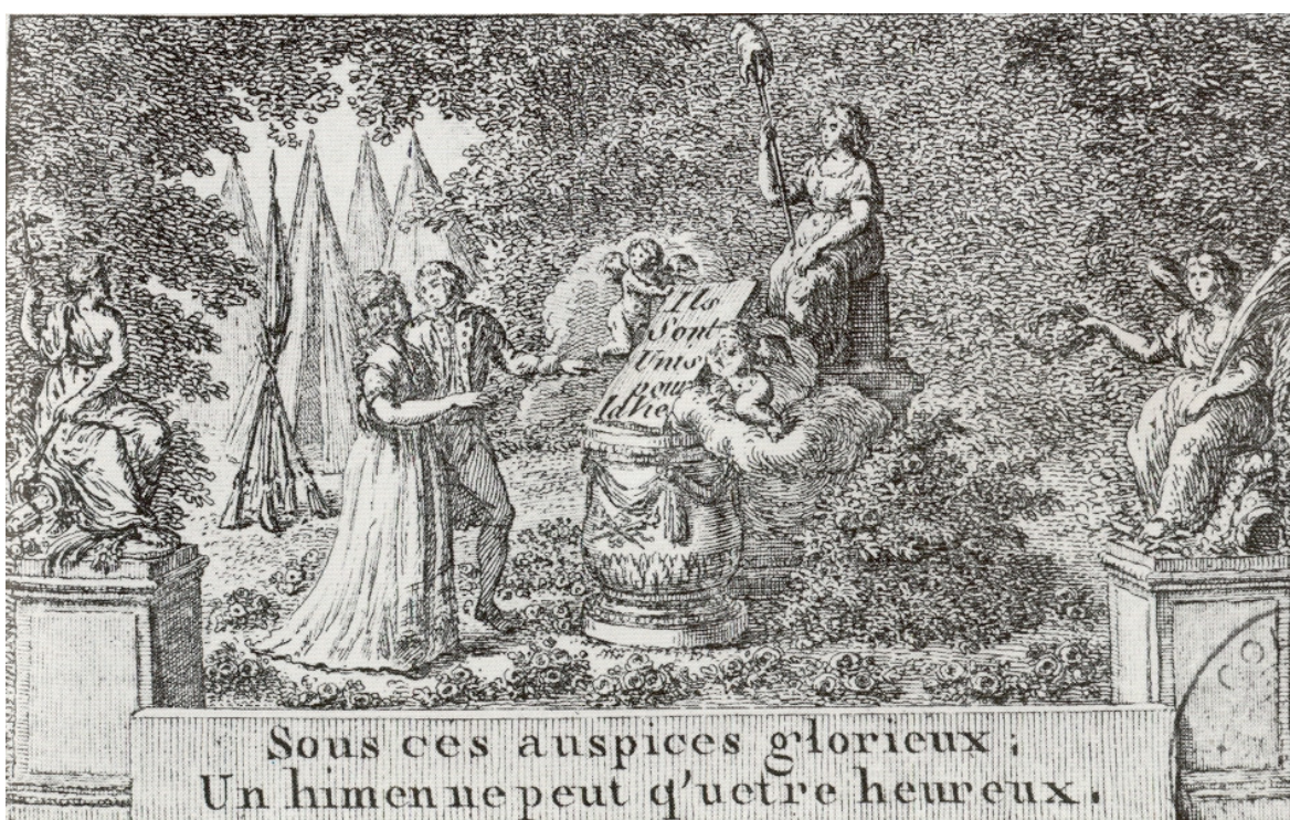
Anonyme, Sous ces auspices glorieux, Un hymen ne peut qu'être heureux (Musée Carnavalet)