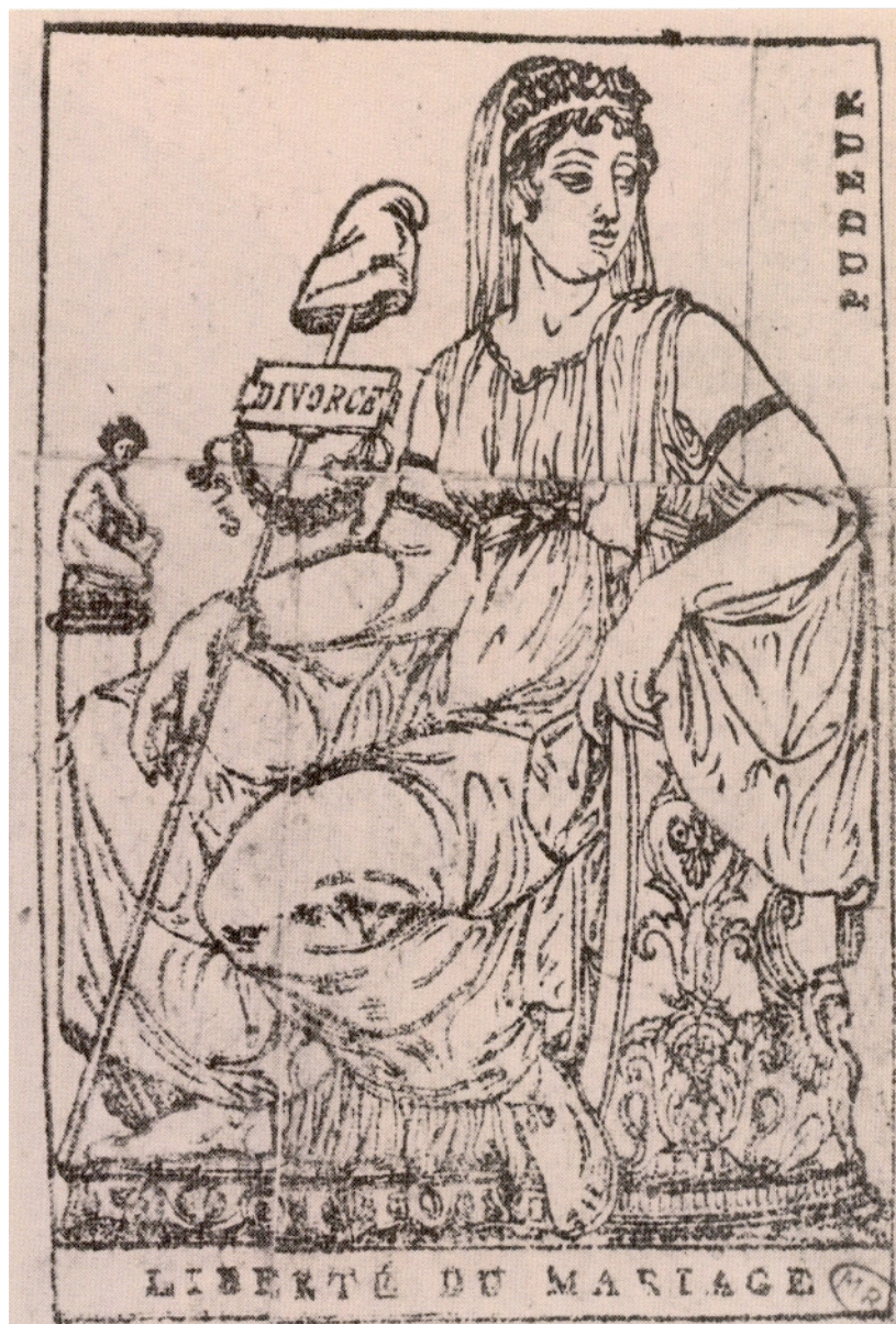
Carte à jouer, Musée de la Révolution, Vizille