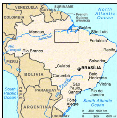
Figure 1: Localisation du front pionnier de la Transamazonienne.

La colonisation par les hommes d'espaces vierges est un phénomène en cours d'achèvement dans le monde. Les grandes forêts tropicales comptent parmi les derniers espaces colonisables ; elles constituent sans doute les dernières frontières en cours d'intégration à l'espace mondial. Leurs habitants originels (les Indiens) sont relégués dans des réserves tandis que les terres sont offertes à la colonisation, le plus souvent agricole : au Brésil, comme dans d'autres pays l'Amérique Latine, des familles d'agriculteurs se transforment en colons pour défricher et cultiver l'immense forêt amazonienne. C'est sur les dynamiques de ces fronts pionniers amazoniens que porte notre travail, en particulier sur le front pionnier ouvert dans les années 1970 le long de la route Transamazonienne, en Amazonie Orientale (voir figure 1).