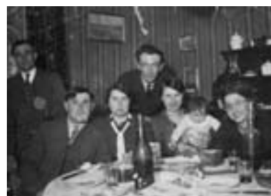
Fig. 13. J. Bastan, scène d'intérieur (famille et amis) tirage argentique, 1940, coll. part.