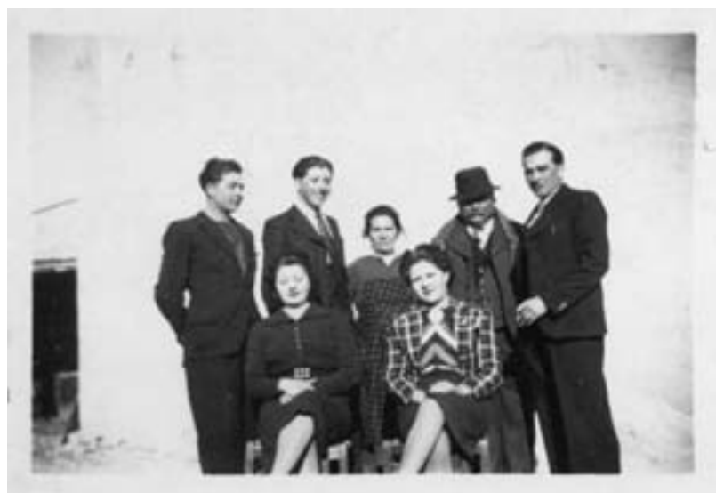
Fig. 11. Anon., la dernière image de la famille Clomel au complet, tirage argentique, 1940, coll. part.