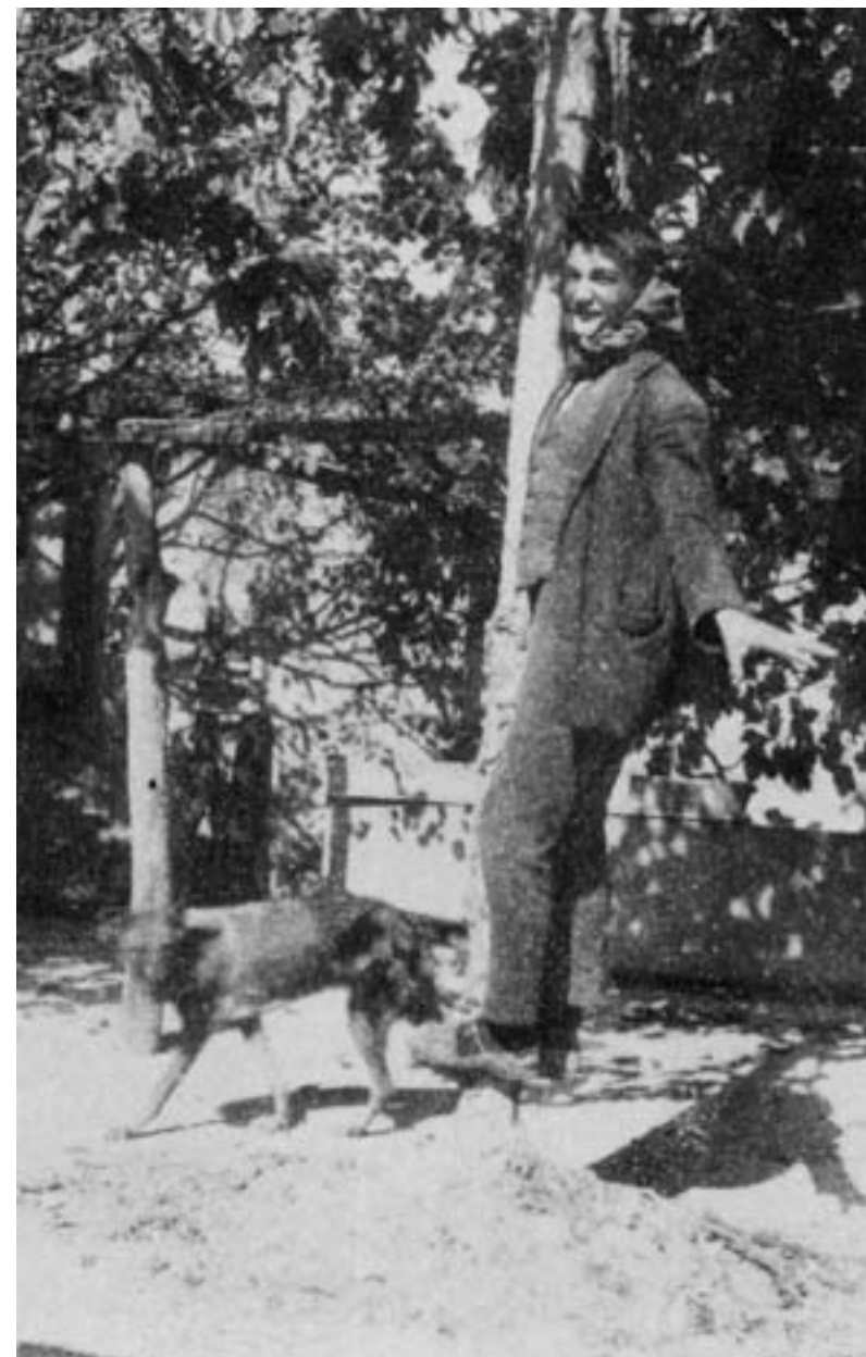
Fig. 5. J. Bastan, scène de pendaison humoristique, tirage argentique, 7 x 5 cm, 1924, coll. part.