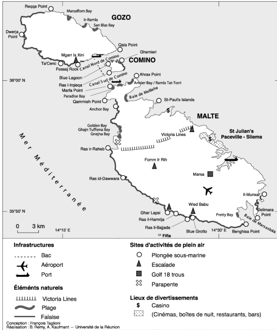
Carte 3. Les activités de plein air et les lieux de divertissements dans l'archipel de Malte