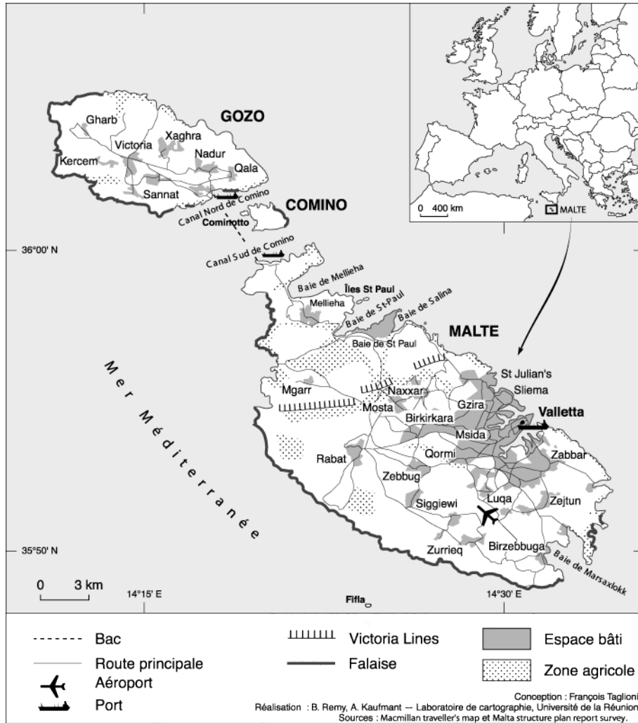
Carte. 1. L'archipel de Malte