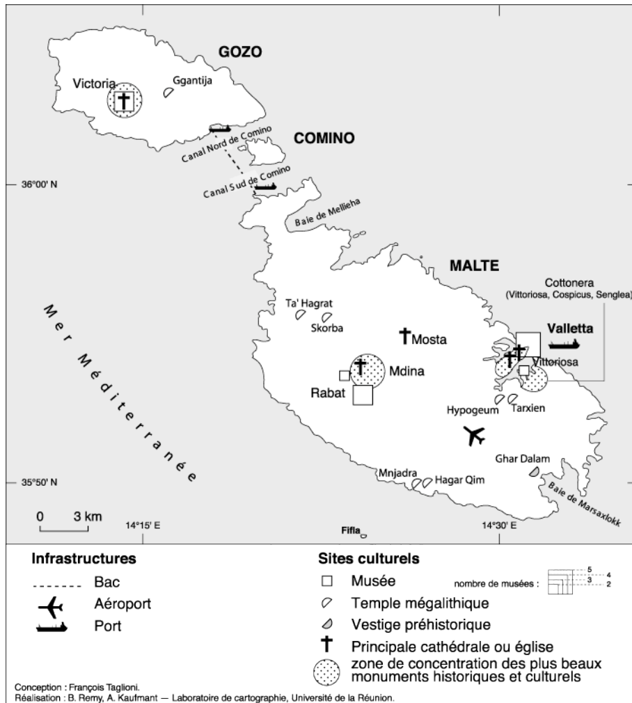
Carte 4. Les sites culturels dans l'archipel de Malte