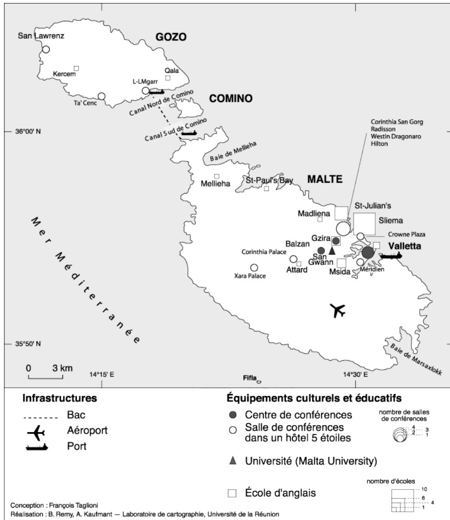
Carte 5. Les équipements culturels et éducatifs dans l'archipel de Malte