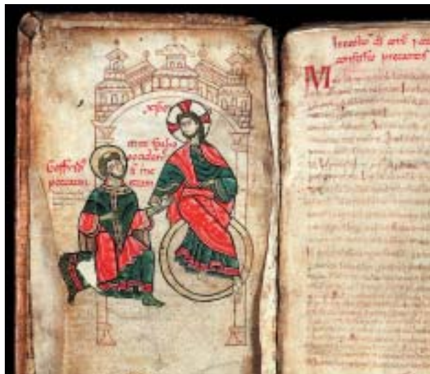
Geoffroy de Vendôme à genou au pied du christ; (Vendôme, Bibl. mun. 193, fol.2v)