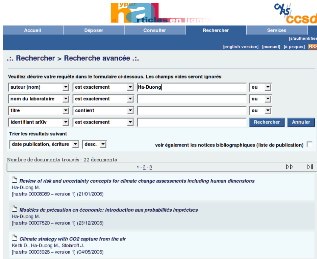
Illustration 2.: Les données sources dans HAL.