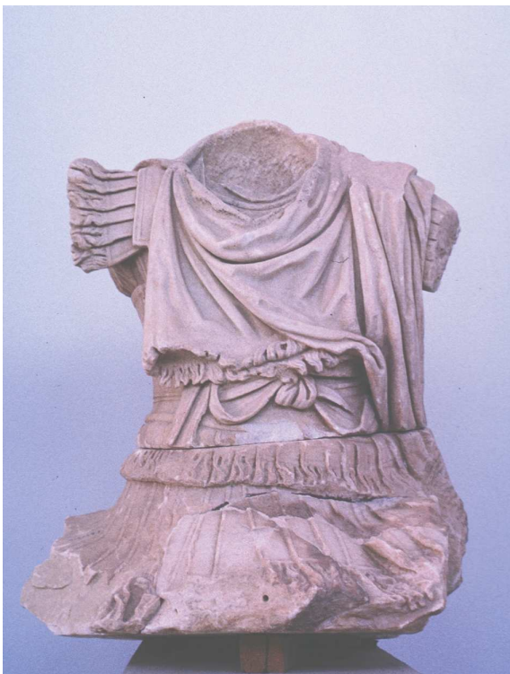
Fig. 3 Torse de cavalier cuirassé, de face - Musée de Délos A 2229 (cliché S. Montel).