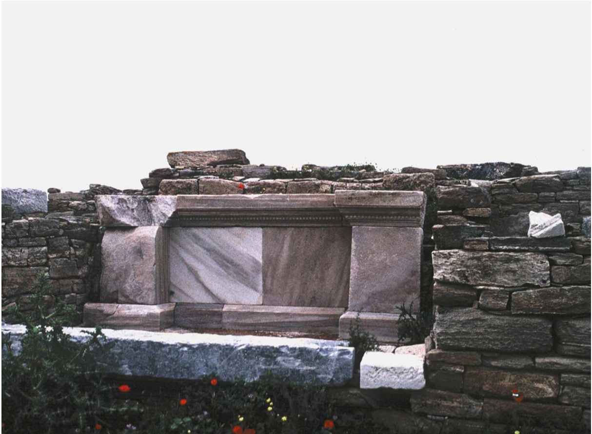
Fig. 2 Niche n°18 : base de la statue de C. Ofellius Ferus.