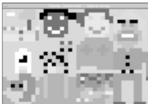
Figure 8. Olivier Auber, Le Générateur poïétique , http://poietic-generator.net

réel 56 . Le principe du Générateur poïétique permet en effet à plusieurs individus de se connecter, à un moment donné, sur un site —le lieu et l'heure du rendez-vous ayant été fixés par courrier électronique— afin de participer à la création d'une image commune. La mise en œuvre du dispositif implique le téléchargement d'un logiciel assez rudimentaire de dessin bitmap dont l'apprentissage est immédiat. La modification de l'image se fait en continu et en temps réel. Chacun pour soi modifie l'image que tous voient, altérant formes et couleurs.