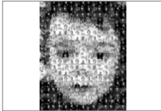
Figure 6. Reynald Drouhin, Des Frags , www.desfrags.cicv.fr

de cette forme d'altération d'images prélevées sur le réseau, réemployées pour composer avec la complicité des internautes de nouvelles images mosaïques.