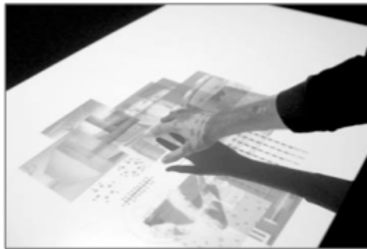
Figure 2. Douglas Stanley, Concrescence , www.abstractmachine.net

Il s'agit là d'environnements logiciels permettant aux utilisateurs l'insertion, la création et la restructuration de sons et d'images 20 .