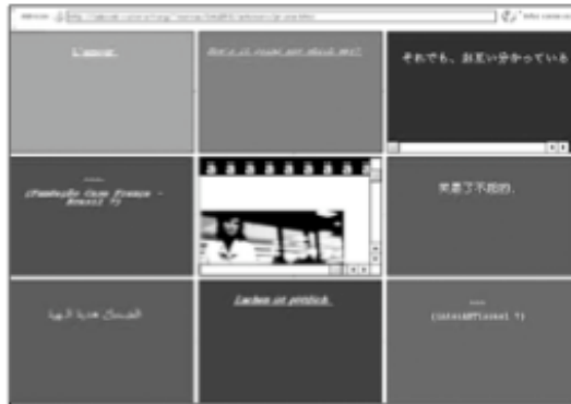
Figure 5. Antoine Moreau, On se comprend , http://antomoro.free.fr/comprend.html

d'hébergement et de connexion. Divers projets déroulent de la sorte la métaphore du rhizome empruntée à Gille Deleuze (1980 : 32).