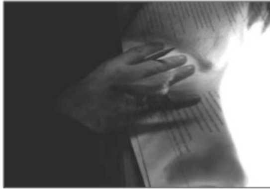
Figure 7. Grégory Chatonsky, Sur Terre, www.arte.tv/sur-terre