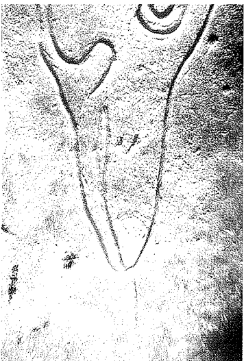
Fig. 1 détail de la tête d'oiseau du galet n°45

également démontrée par le fait qu'aucune différence de patine ne s'observe entre les traits gravés, la surface naturelle du galet et la zone utilisée. Un court trait d'aspect récent, par contre, est gravé sur la face portant les traces d'utilisation. Il diffère clairement, par sa patine et son état de conservation, des traits gravés paléolithiques. Le long cou, le bec allongé et arrondi à son extrémité évoquent une représentation d'anatidé. Tout essai d'identification plus poussé recèle un caractère subjectif. On remarquera la volonte de réalisme du graveur, qui a indiqué par un demi-cercle les narines et par deux fins traits parallèles le changement de couleur au bout du bec. Le repli gravé sous l'œil peut indiquer une tache du plumage ou le lore. (fig. 1) F. DIE. et V. L.