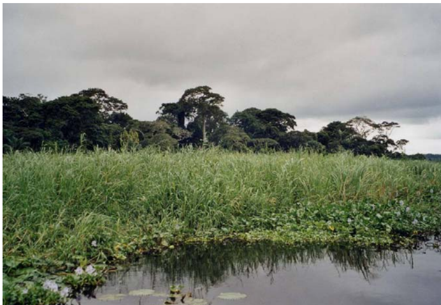
Photo n°2 : Bamèzoun (village de Bembé, Ouémé, Bénin) : forêt sacrée, site classé Ramsar, devient réserve biologique

mondiale) dont celle de Bamèzoun. Cependant, cette forêt, site sacré, classée RAMSAR 24 , réserve biologique, reste un lieu d'exploitation du bois de feu et les habitants ne voient pas d'évolution de leur situation économique, les rares touristes venant en pirogue depuis Porto Novo ne s'arrêtant pas à Bembé.