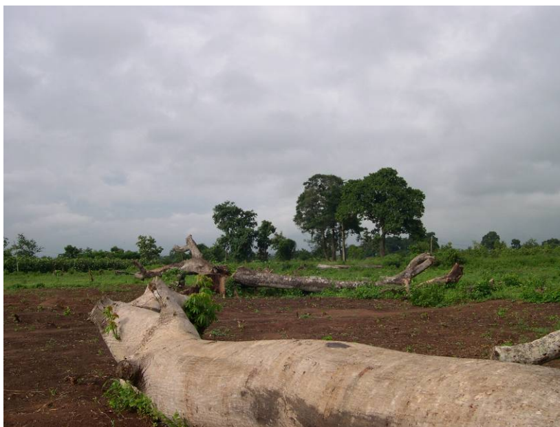
Photo n°1 : Le bois sacré a été sacrifié au développement de l'économie locale : les arbres abattus seront remplacés par les étalages du marché

Forêts et des Ressources Naturelles, départements du Mono et de l'Atlantique, Bénin). Ils sont inexistantes au Togo pour le moment, même si cette année, la journée de l'arbre du 1 er juin a été célébrée en présence des autorités administratives dans le bois sacré d'Assouame dans la préfecture de Tsevie en vue de sa restauration par plantations. Les agents forestiers interviennent aussi pour constater les effractions et dresser des procès-verbaux 16 . Malheureusement, ils arrivent bien souvent trop tard pour arrêter le processus. C'est ainsi qu'un îlot forestier de 2 ha. situé sur la commune d'Akassato (Bénin) a pu être entièrement défriché par un collectif de villageois avant que les agents n'arrivent sur place à la demande de la famille détentrice des droits sur le bois. 17