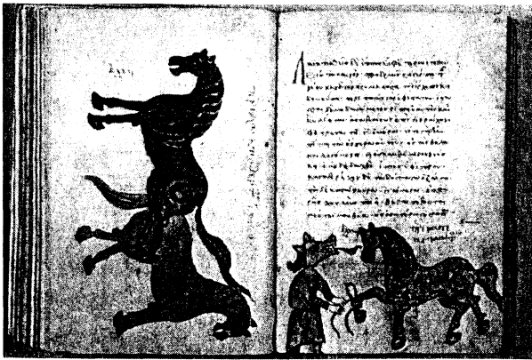
Fig. 3 - Leiden, Bibliotheek der Rijksuniversiteit, Vos. gr. Q. 50, f. 67 r -68 r

En dehors des caractéristiques communes aux miniatures des deux manuscrits, deux autres éléments du costume des personnages du manuscrit de Paris nous semblent utiles afin d'essayer de cerner les influences reçues: la coiffure et la tunique. La forme de cette dernière, comme je l'ai déjà écrit est presque identique dans les deux manuscrits et à ce titre elle sera décrite pour les