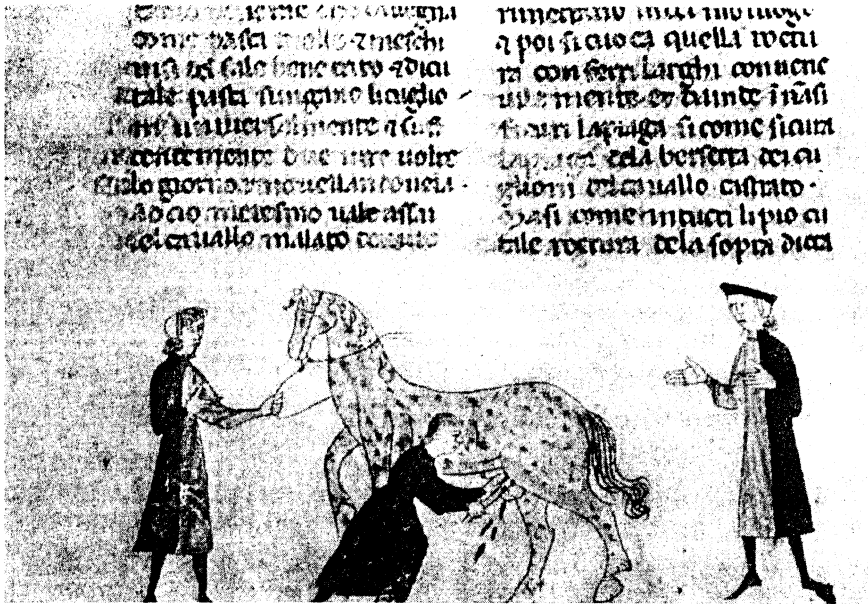
Fig. 8 - Berlin, Staatliche Museen zu Berlin. Kupferstichkabinett, 78. C. 15, f. 14 v (détail).

Museen zu Berlin. Kupferstichkabinett, 78. C. 15 97 de la fin du XIII e siècle qui contient, parmi d'autres textes, la version italienne du traité de Jordanus Rufus de Calabre De medicina equorum 98 . Dans ce manuscrit nous retrouvons, entre autres, les chaussures pointues et surtout la tunique bicolore (fig. 8). De même, nous retrouvons des drôleries identiques à celles rencontrées dans le manuscrit de Leyde (voir n. 44 et 46-47 et figs. 3-4) dans d'autres manuscrits hippiatriques occidentaux ( London, British Library, Add. 15097 où au f. 72 v par exemple on voit un être au corps de singe et au visage humain; ou encore, New York, Pierpont Morgan Library, M 735 où on voit un être mi-homme mi-animal au f. 70 f et un oiseau au f. 77 v qui tient par les rênes le cheval, figs. 9-10) 99 .