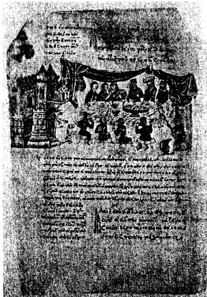
Fig. 7 - Paris, Bibliothèque national de France, grec 135, f 18 r .