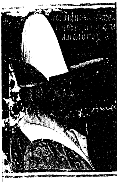
Fig. 5 - Sina, Μονή τῆς Ἁγίας Αἰκατερίνης (Sinaï, Sainte-Catherine), 2123, f. 30r (détail).

trompé en suivant, probablement, L. Bréhier 73 qui a confondu le skiadion avec le kamelaukion 74 . A en croire les textes presque tous les fonctionnaires le portaient. Toujours selon J. Verpeaux, il faut voir derrière l'étymologie du nom un chapeau qui protège du soleil, je dirais même qui a comme rôle de garder son porteur dans l'ombre, donc littéralement, une sorte de parasol 75 .