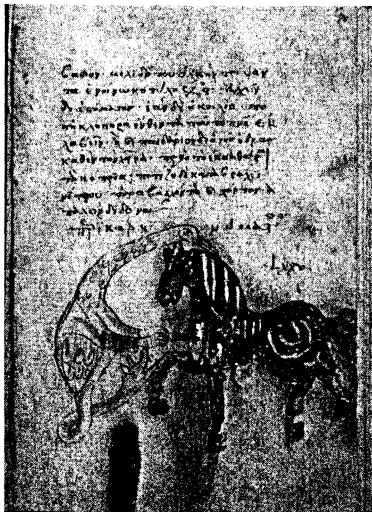
Fig. 4 - Leiden, Bibliotheek der Rijksuniversiteit, Vos. gr. Q. 50, f. 70 r .

Certains personnages sont représentés avec un couvre-chef au rebord large en arrière et pointu, comme un bec, à l'avant 67 . Son contour est noir et il est, le plus souvent, rouge pâle et blanc par endroits. Aucune décoration n'est apparente sauf peut-être au folio 8 r où des traits verticaux et horizontaux auraient pu avoir été utilisés pour suggérer la présence de perles ou d'un brochage au fil d'or. Ce type de couvre-chef n'était pas inconnu à Byzance à l'époque des Paléologues. Nous pouvons le rapprocher d'un chapeau cité par pseudo-Kodinos 68 , au moins 43 fois, sous le nom de skiadion (τὸ σκιάδιον) 69 . Selon J. Verpeaux ce même terme est utilisé également par Mathieu Blastarès et par Syméon de Thessalonique 70 . Il s'agit d'un mot technique qui désigne le couvre-chef de l'empereur comme celui des dignitaires laïcs et ecclésiastiques mais qu'il ne faut pas confondre avec d'autres coiffures comme J. Ebersolt l'a fait avec le skaranikon 71 . A. Chastel 72 s'est également