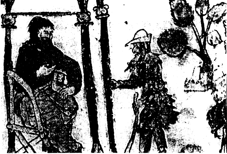
Fig. 6 - Paris, Bibliothèque nationale de France, grec 135, f. 20 r (détail).