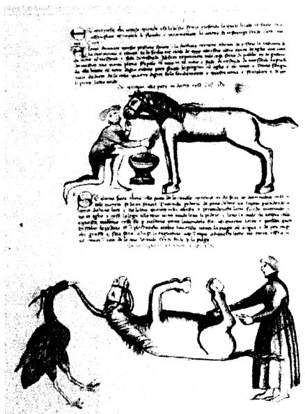
Fig. 10 - New York, Pierpont Morgan Library, M 735, f. 77 v