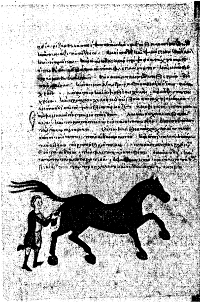
Fig. 1 - Paris, Bibliothèque nationale de France, grec 2244, f. 33 v .