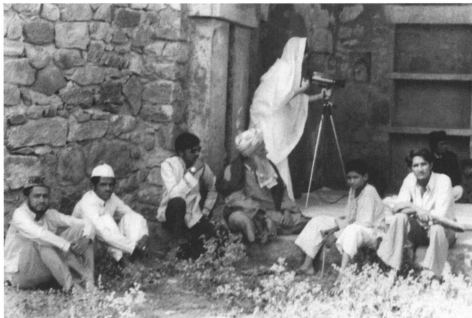
Fig. 2: Enregistrement vidéo d'une assemblée de qawwali au chilla (lieu de retraite spirituelle) du saint Nizamuddin Auliya, au tombeau de Humayun. Photo: Saleem Qureshi, Delhi, 1976.