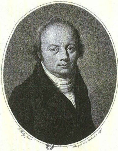
Portrait du Docteur F. J. Gall, gravure de Boilly d'après Bourgeois de la Richardière (BM Lyon, Estampe Gall).