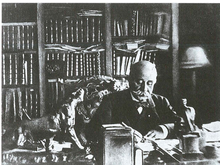
Portrait photographique d'Alexandre Lacassagne à la fin de sa carrière, assis à sa table de travail.

– "La justice flétrit, la prison corrompt et la société à les criminels qu'elle mérite." 1