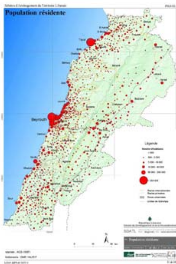
Fig 1 : La population résidente

Ce canal qui convoie l'eau depuis le lac de Qaraoun, formé par le fleuve Litani, avait été construit avant qu'il ne subisse les dégradations de la guerre. Sa réhabilitation, entamée en 1995 puis achevée en 2002, permet d'irriguer un casier de terres sises sur la rive orientale du Litani qui représente 2000 hectares répartis sur 5 villages (Joub Janine, Kamed el Loz, Baaloul, Lala et Qaraoun). Après trois années de fonctionnement, il est intéressant de voir si l'apport de ce canal constitue une avancée pour la zone. De fait, ce projet souligne, s'il était besoin, que le développement n'est pas réductible à de simples travaux d'aménage d'eau, contrairement à ce qu'une certaine pratique d'aménagement a pu faire croire.