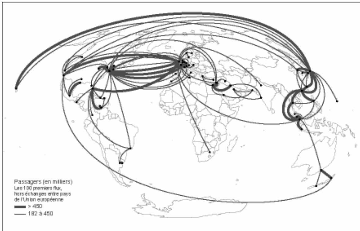
Figure 2 - Flux aériens internationaux de passagers en 1981