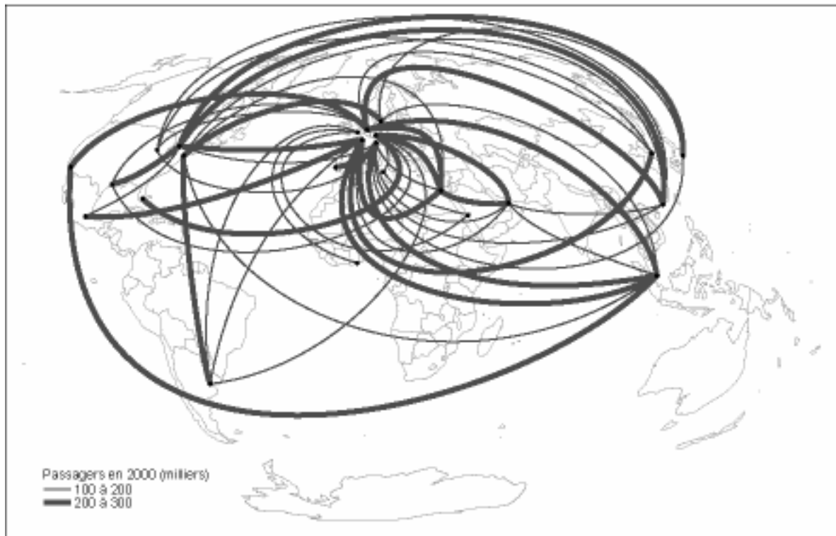
Figure 4 - Polarité* de réseau