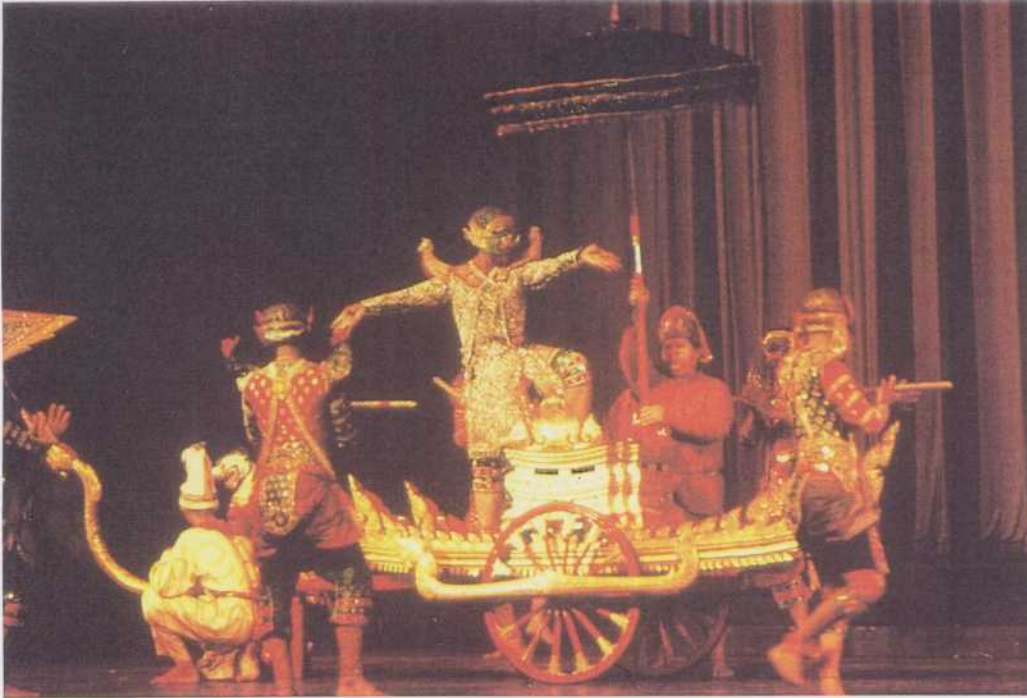
Spectacle de danse masqué « khon » (théâtre masculin). Un démon du « Rāmāyana » se dresse sur son char. Dans la tradition thaï, seul le répertoire du « Rāmāyana » est chanté, dansé et théâtralisé. Bangkok, 1983 (C. Hemmet).

outre, les mœurs, les observances religieuses et primitives sont bien celles du kraton javanais au temps de l'empire Majapahit. La littérature et les arts sont ceux de la cour : ainsi assiste-t-on à une représentation de gambuh , cette forme de théâtre chanté très ancienne dont la stylisation met l'accent sur l'esthétique visuelle et vocale plus que sur l'histoire dramatique, encore vivante à Bali, et à une représentation de raket , un théâtre masqué qui est l'antécédent probable du topeng . Poerbatjaraka a considéré huit versions écrites de Panji : outre cinq versions en javanais moderne, on connaît une version en javanais moyen, une version malaise, une version cambodgienne et une édition critique traduite en anglais. Néanmoins, chaque village peut avoir sa propre version et sa dramaturgie de l'histoire de Panji.