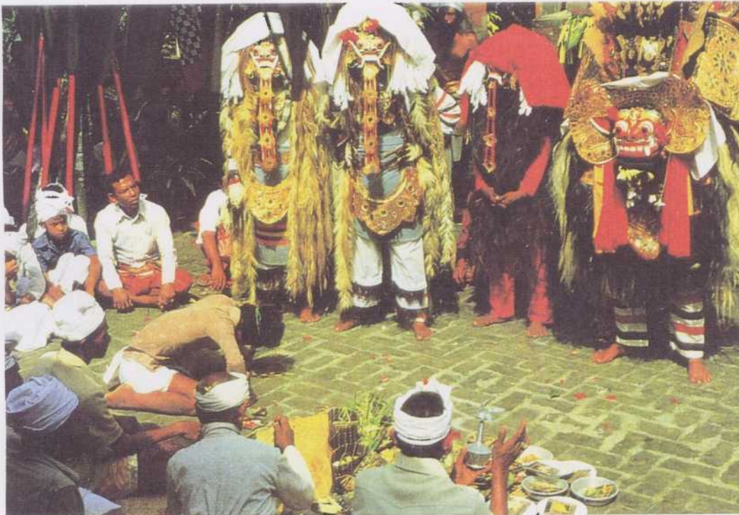
Spectacle rituel du « barong » dans un enclos balinais. Les forces du bien symbolisées par deux grands lions parés, deux « barong », jouent les forces du mal symbolisées par deux grandes « rangda », tandis que le « gamelan » interprète la pièce qui pendant des heures accompagne musicalement leur combat, et conduit plusieurs participants à un état de transe. Bali, village de Panglipuran, 1981 (N. Revel).

Cinq familles linguistiques se déploient du sud de la Chine jusqu'aux marches orientales de l'archipel nusantarien et à l'île de Madagascar, à l'extrémité occidentale de l'océan Indien. L'Asie du Sud-Est linguistique commence avec la famille thaï-kadaï. Les Miao-Yao, population autochtone de la Chine, sont descendus pendant des millénaires, si bien que les langues de la famille miao-yao s'imbriquent désormais avec les dialectes chinois de la famille sinotibétaine, ainsi que les langues de la famille thaï du Guanxi et du Yunnan. Cette dernière famille