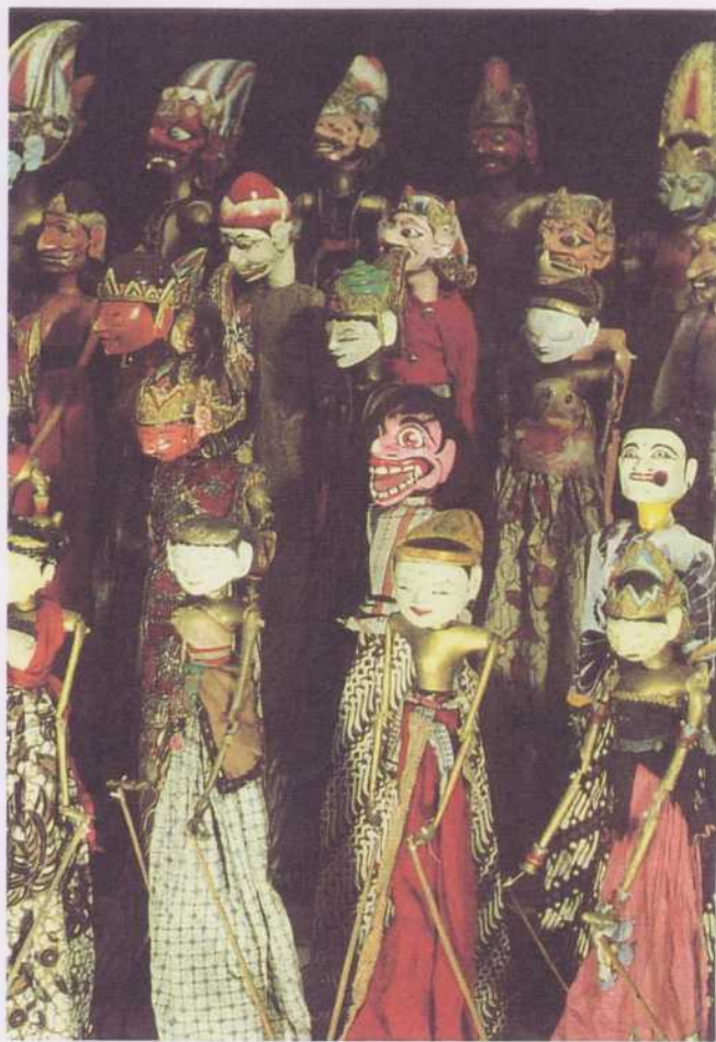
Le « wayang golek ». Ce type de spectacle particulièrement populaire à Java fait intervenir des marionnettes sculptées dans le bois et revêtues d'étoffes colorées. Elles sont maniées par le « dalang », à la fois conteur et manipulateur.