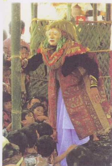
De la performance au cérémonial. En Asie du Sud-Est, le terme « wayang » recoupe une réalité plus large que celle de « théâtre » ou de « spectacle ». L'importance rituelle que contiennent d'avoir les différentes traditions – qu'elles s'appuient sur les marionnettes ou sur les masques – contribue à préserver leur sens sacré original de contact avec les esprits et les ancêtres. Photo de droite : théâtre masqué à Bali.