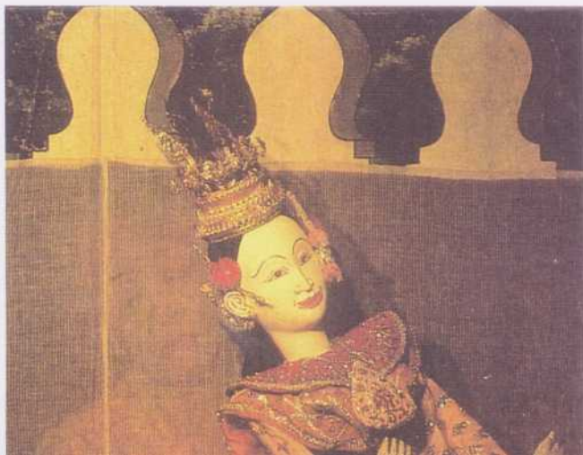
Spectacle de marionnettes « hun krabok » (« poupée sur tube de bambou »). Dans cet extrait du « Rāmāyana », Benjakai, fille de Piphek, prit l'apparence de Sita pour abuser Rama. En transparence, derrière l'écran, la main de marionnettes insufflé la vie à la poupée. Bangkok, 1980.

Au centre d'un enclos familial se dresse un bâtiment qui devient lieu du culte des ancêtres.