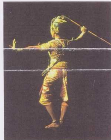
Spectacle de danse « lakhon » (théâtre féminin). Le « Rāmāyana », les contes traditionnels et les œuvres d'auteurs comme le poète Sunthon Phu constituent le répertoire de ce théâtre. Bangkok, 1982.

Les récits épico-mythiques des Bugis de Célèbes, connus sous le nom de « I La Galigo », relèvent également de l'oralité mixte. Ils furent initialement copiés en syllabaire bugis sur feuilles de palmier ( lontar ) et, depuis le XVII e siècle, sur papier (6 000 pages). Les lettrés, de nos jours, n'en possèdent que des épisodes ou des fragments. L'œuvre a été divisée en cinq parties : la première nous livre le mythe de la création, l'origine et la descente sur terre de Batara Guru, et le mythe de la fondation du royaume de Luwu'. La deuxième partie est l'histoire d'un héros, ses périples en mer, son mariage et la naissance d'un fils : I La Galigo, qui devient le héros de la troisième partie et incarne l'archétype du prince bugis, dont la valeur guerrière se double d'une grande séduction. Composée en suré' – un mètre de cinq ou quatre syllabes avec une accentuation diffé-