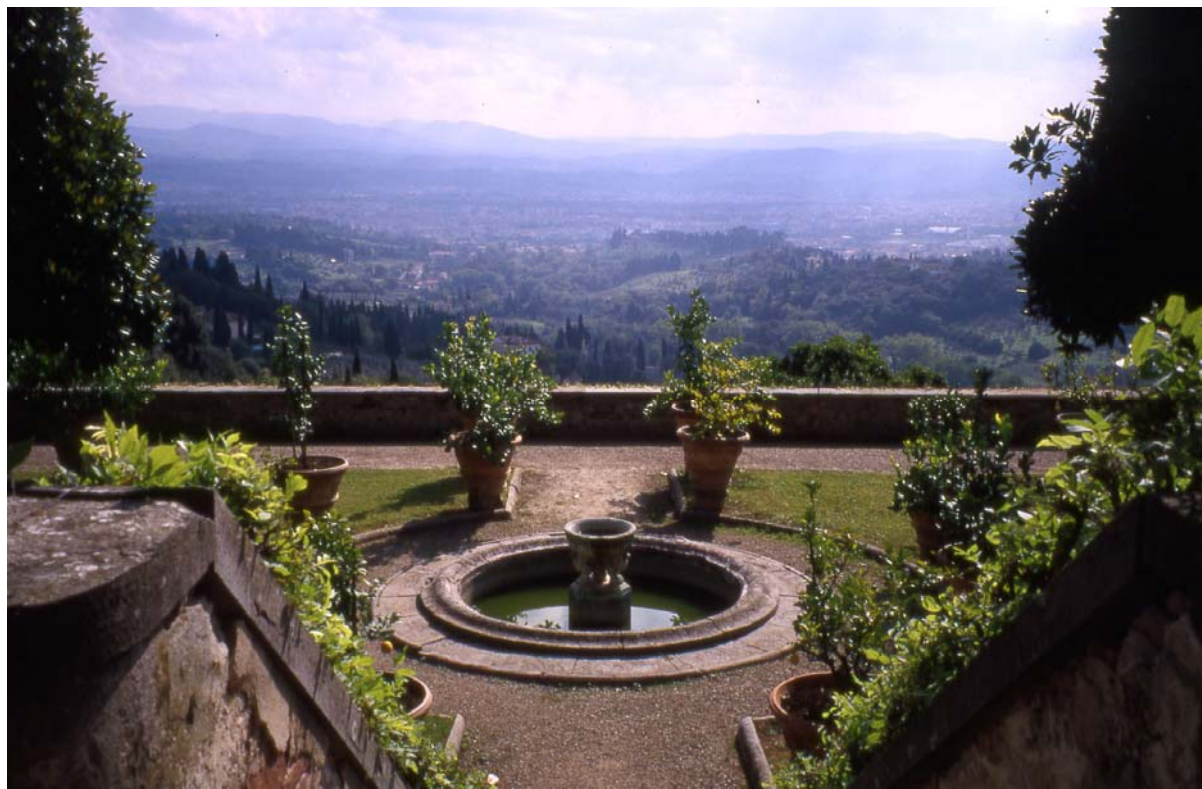
2. La finitude ouverte : villa Médicis à Fiesole (Florence).

et de représenter la ligne de tension instable par laquelle ils s'accolent. En fait, la clôture est l'axe d'un jeu duel entre l'intérieur et l'extérieur qui s'accomplit dans un rapport formel 31 ». On pourrait ainsi revisiter l'histoire des jardins uniquement à partir de cette dialectique de la limite qui amène à reconsidérer la manière dont le jardin dialogue avec le paysage.