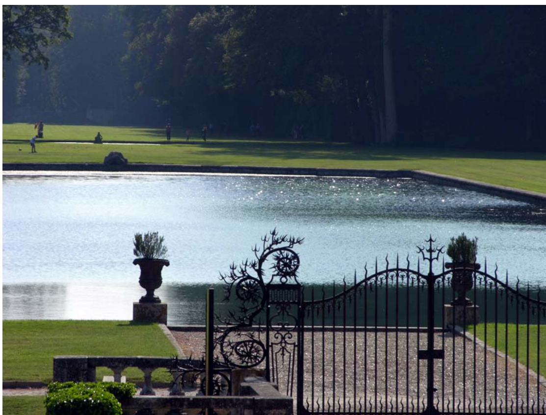
4-5. Les temporalités du jardin comme système vivant : Courances (Essonne). Long de 500 mètres, le canal appartient à un réseau hydraulique mis en place à la Renaissance. Plantés il y a un demi-siècle, ces peupliers devront être remplacés durant l'hiver 2006-2007. Installé avant 1756, le miroir d'eau qui souligne l'axe central est un dispositif à capter la lumière d'un instant.