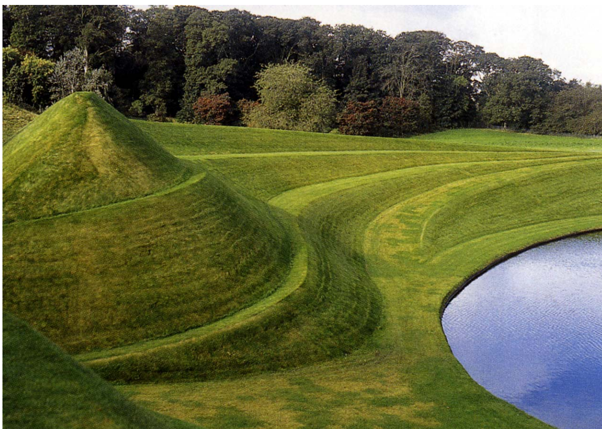
6. Le mésocosme : le jardin de la Spéculation cosmique, Portrack Garden, Holywood (Dumfriesshire). Le tertre de l'Escargot et les lacs Limaçons font allusion à la géomancie traditionnelle et aux théories contemporaines du chaos.

« réunir en un seul jardin tous les temps et tous les lieux ». Cette proposition globalisante, dès son époque, fit l'objet d'acribes critiques. Il semble, en effet, que l'hétérotopie le cédait à l' hypertopie , l'accumulation de lieux multiples en un seul espace, comme en témoigne l'Abbé Delille – parmi bien d'autres – dans son poème : Les Jardins (1782), qui taxe le goût pour les fabriques de « chaos d'architecture » ... Et Baltrusaitis de répondre : « La profusion et la diversité du monde se révélant dans le chaos, le chaos y est son ordre. [...] À peine, la nature découverte, la nature est toute entière transfigurée et transposée dans le domaine visionnaire et symbolique 68 ».