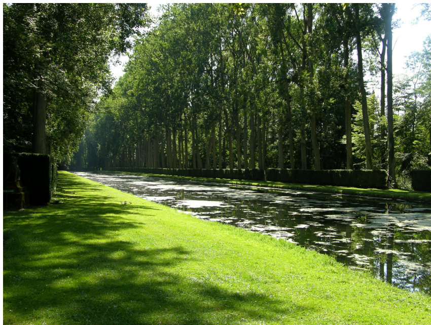
Fig. 4. Courances (Essonne).

Long de 500 mètres, le canal appartient à un réseau hydraulique mis en place à la Renaissance. Plantés il y a un demi-siècle, ces peupliers devront être remplacés durant l'hiver 2006-2007.