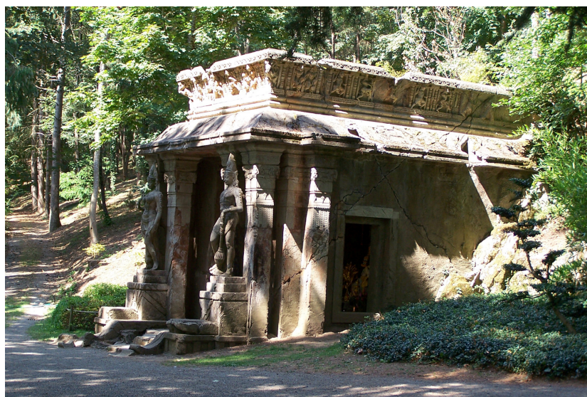
Fig. 2. Parc oriental, Maulévrier (Maine-et-Loire). Le temple khmer fait écho à la pagode cambodgienne qu'Alexandre Marcel réalisa pour l'Exposition Universelle de Paris en 1900.