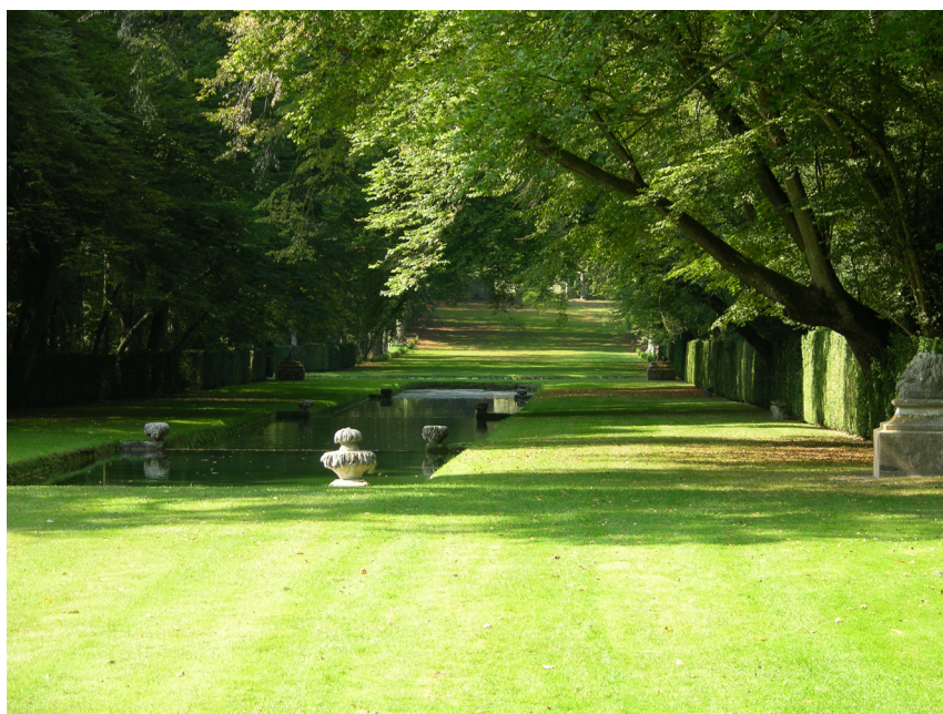
Fig. 5. Courances (Essonne).

Long de 500 mètres, le canal appartient à un réseau hydraulique mis en place à la Renaissance. Plantés il y a un demi-siècle, ces peupliers devront être remplacés durant l'hiver 2006-2007.