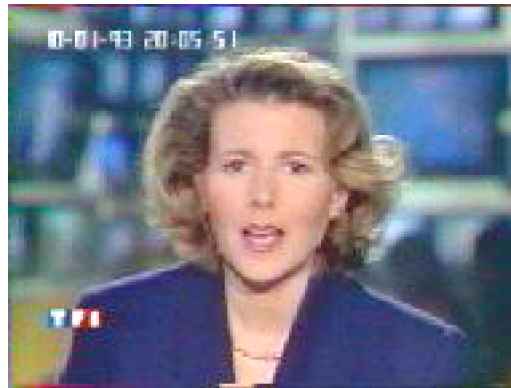
Fig.2. Le logo permanent

Par son omniprésence, le logo devient le principal marqueur identificatoire des chaînes. Il est en effet bien loin de ne faire que remplacer le chiffre incrusté sur l'écran par les télécommandes après chaque pression de bouton : il ne disparaît pas au bout de quelques secondes, et a été dessiné pour représenter une chaîne en particulier. Par lui, la cohérence du JT est portée à son summum. Toutes les images qui y sont diffusées sont marquées du même sceau. Ce sont elles, et non plus les journalistes qui sont désignées comme appartenant à la chaîne. Mais au-delà d'une cohérence accrue, l'évolution de la place du logo dans les JT renseigne sur une dimension importante de la visibilité des chaînes à l'antenne. En se détachant du décor, puis du nom des journalistes, cet élément identificatoire majeur investit peu à peu un lieu spécifique. Tandis que l'axe de la caméra, ou le contenu même des images changent, le logo reste en place. Il n'est pas simplement installé au premier plan de chaque image, mais au premier plan du JT dans son ensemble.