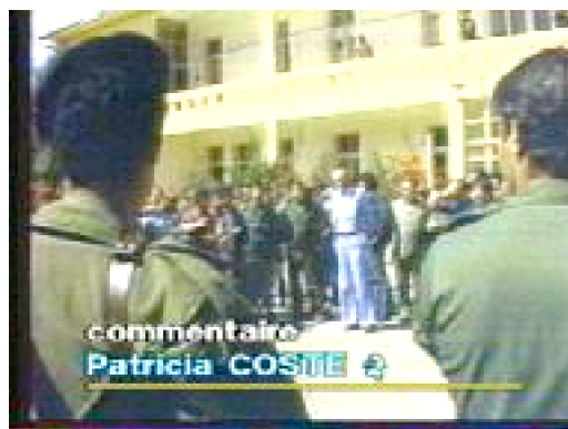
Fig.1. Le logo de la chaîne avec la signature des journalistes (Antenne 2 - 06/1983)

En parallèle de ce déplacement, le logo qui figurait dans le décor du JT est abandonné (en 1985 pour TF1 et 1988 pour Antenne 2). Cette disparition ouvre la voie à une grande transformation du plateau des journaux : à partir de ces dates, ceux-ci se vident peu à peu d'éléments matériels (tables, plantes, moulures) pour devenir « abstraits ». Le fond devant lequel le présentateur, les journalistes et les invités interviennent est désormais constitué de moniteurs vidéo laissés dans le flou par l'utilisation d'une focale particulière.