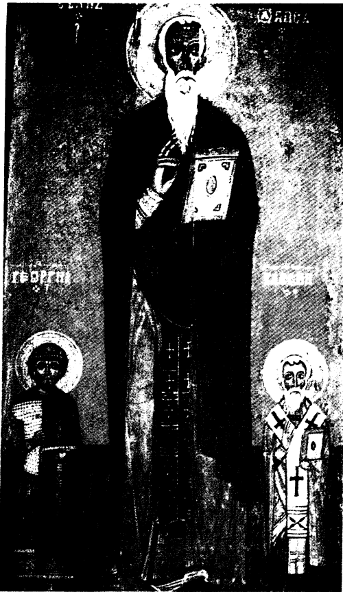
Fig. 5: Pl. II : Les Saints Jean Climaque, Georges et Blaise, XIII e siècle (Saint Petersburg, Musée russe). Source: E. SENDRER, L'icône. Image de l'invisible. Elements de théologie, esthétique et technique [Collection Christus, 54], Paris, 1981, p. 144.