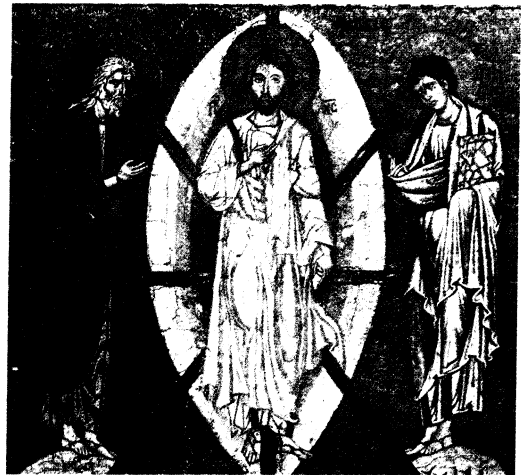
Fig. 6: Transfiguration du Christ, icône en mosaïque, tournant du XII e -XIII e siècle (Paris, Musée du Louvre).