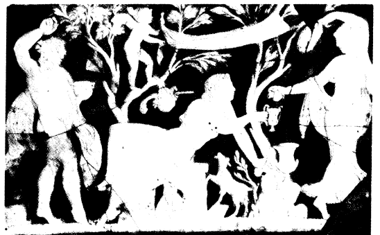
Fig. 4: Initiation d'Ariane aux mystères dionysiaques (Pompéi, Maison de Fabius Rufus), fin du 1 er siècle av. J.-C.-début du 1 er siècle ap. J.-C. (Naples, MANN, inv. 153651).