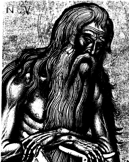
Fig. 7: Emmanuel Tzanès, Saint Onophre, a. 1662 (Athènes, Musée Benaki).