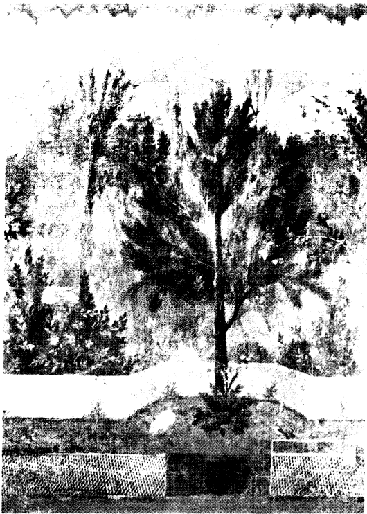
Fig. 1: Jardin cultivé, (Pompéi, Maison de Livie), 1 er siècle av. J.-C. (Rome, Musée des Thermes).