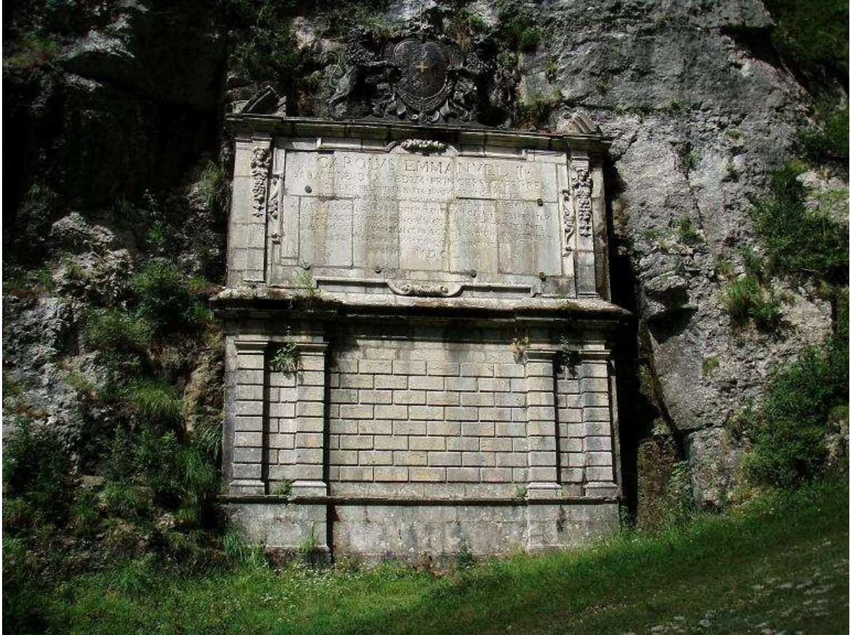
Monument érigé en l'honneur de Charles-Emmanuel II, en bordure de la route des Echelles (1670) (état en août 2007,)